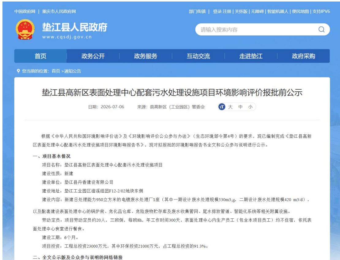
报批前网络公示截图

http://www.cqsdj.gov.cn/tzgg/202607/t20260706_15802608.html