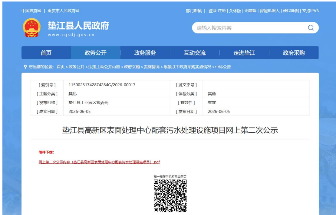
第二次网上公示截图

公示内容包括：（1）环境影响报告书征求意见稿全文的网络链接及查阅纸质报告书的方式和途径；（2）征求意见的公众范围；（3）公众意见表的网络链接；（4）公众提出意见的方式和途径；（5）公众提出意见的起止时间等必要内容。