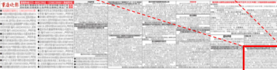
图 3.2-2 征求意见稿报纸公示截图（4月24日）