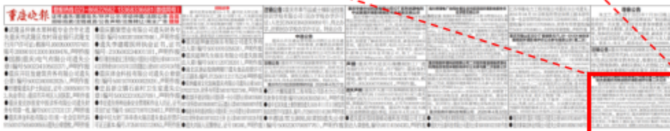
图 3.2-3 征求意见稿报纸公示截图(4月27日)

重庆新铝时代循环科技有限公司重庆綦江新铝时代铝合金循环利用项目环境影响评价第二次公示 重庆新铝时代循环科技有限公司委托中煤科工重庆设计研究院(集团)有限公司承担重庆綦江新铝时代铝合金循环利用项目的环境影响评价工作,现该项目环境影响报告书(征求意见稿)已编制完成,根据《环境影响评价公众参与办法》相关信息已在网站 http://www.cqqj.gov.cn/bm/qsthjj/zwgk_58420/fdzdgnr_58422/hjxypj/jxsmhpspqk/202604/t20260423_15631744.html 上发布,请登录该网站查询该项目详细信息。建设单位:重庆新铝时代循环科技有限公司,冯工 17783084055 Email: csufht@live.cn; 环评单位:中煤科工重庆设计研究院(集团)有限公司,赖工 023-68725603 邮箱 2395365031@qq.com