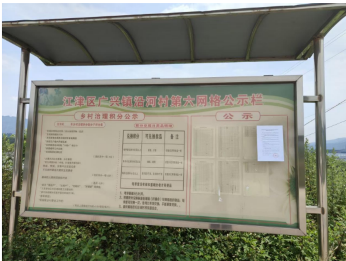
广兴镇沿河村（江津区）