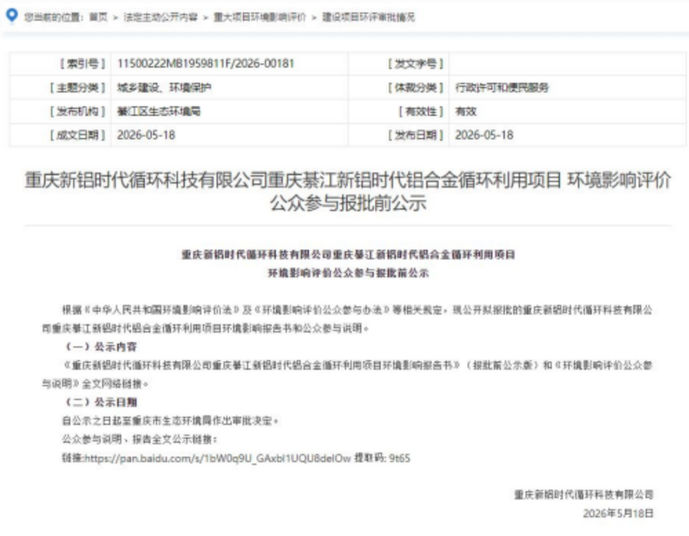
图 6.2-1 报批前公示截图