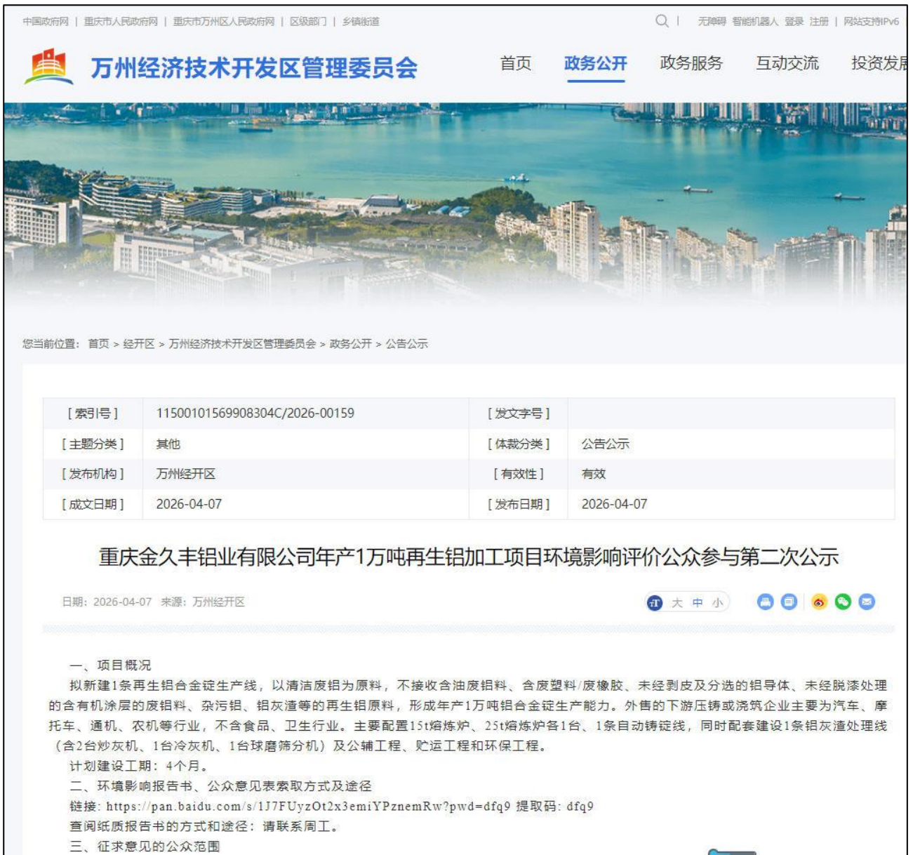
图 3-1 征求意见稿网络截图