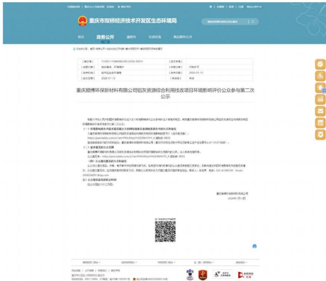
图2 征求意见稿网络公示截图

建设单位于2026年1月13日~2026年1月26日在重庆市双桥经济技术开发区生态环境局官方网站进行网络公示。