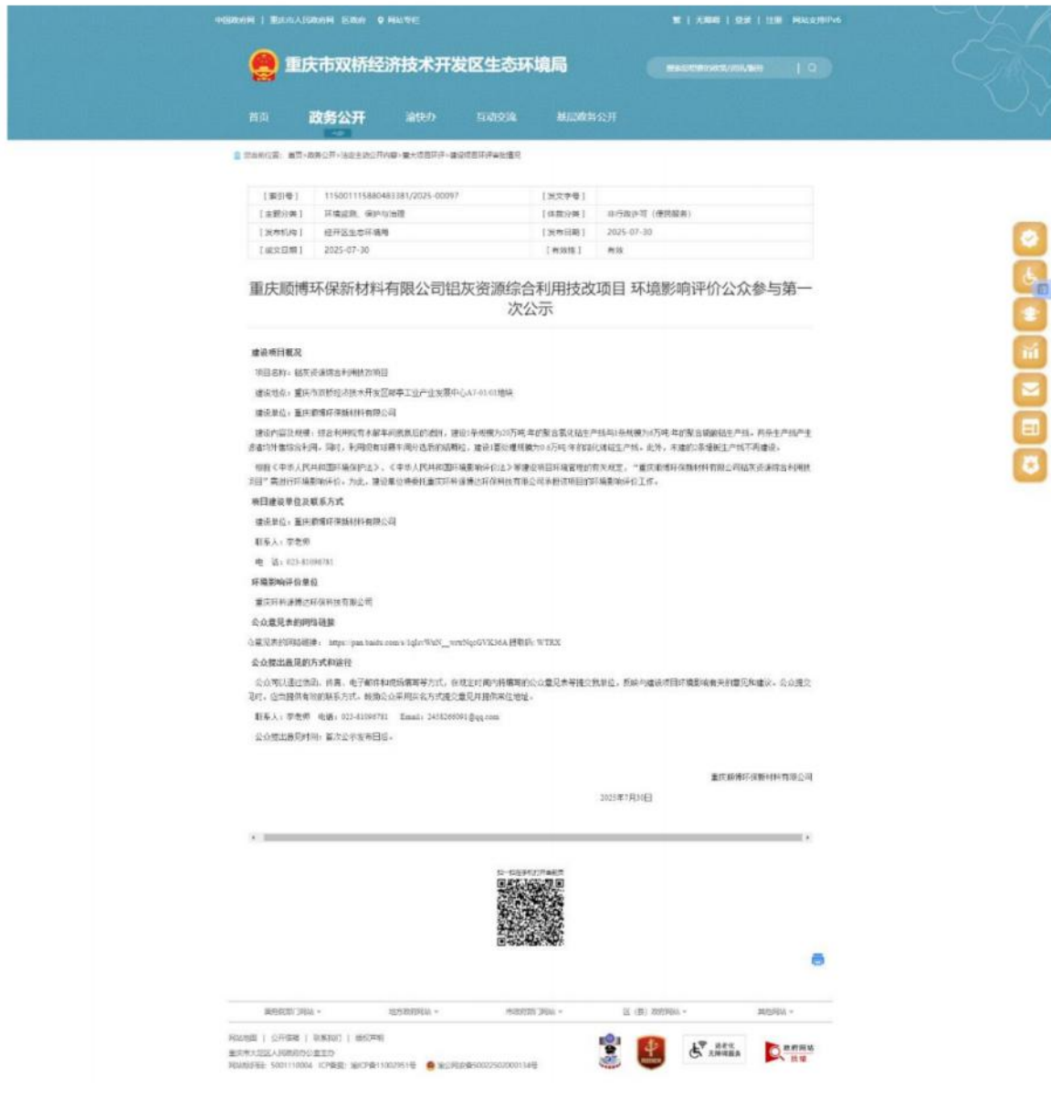
图 1 首次网上公示截图