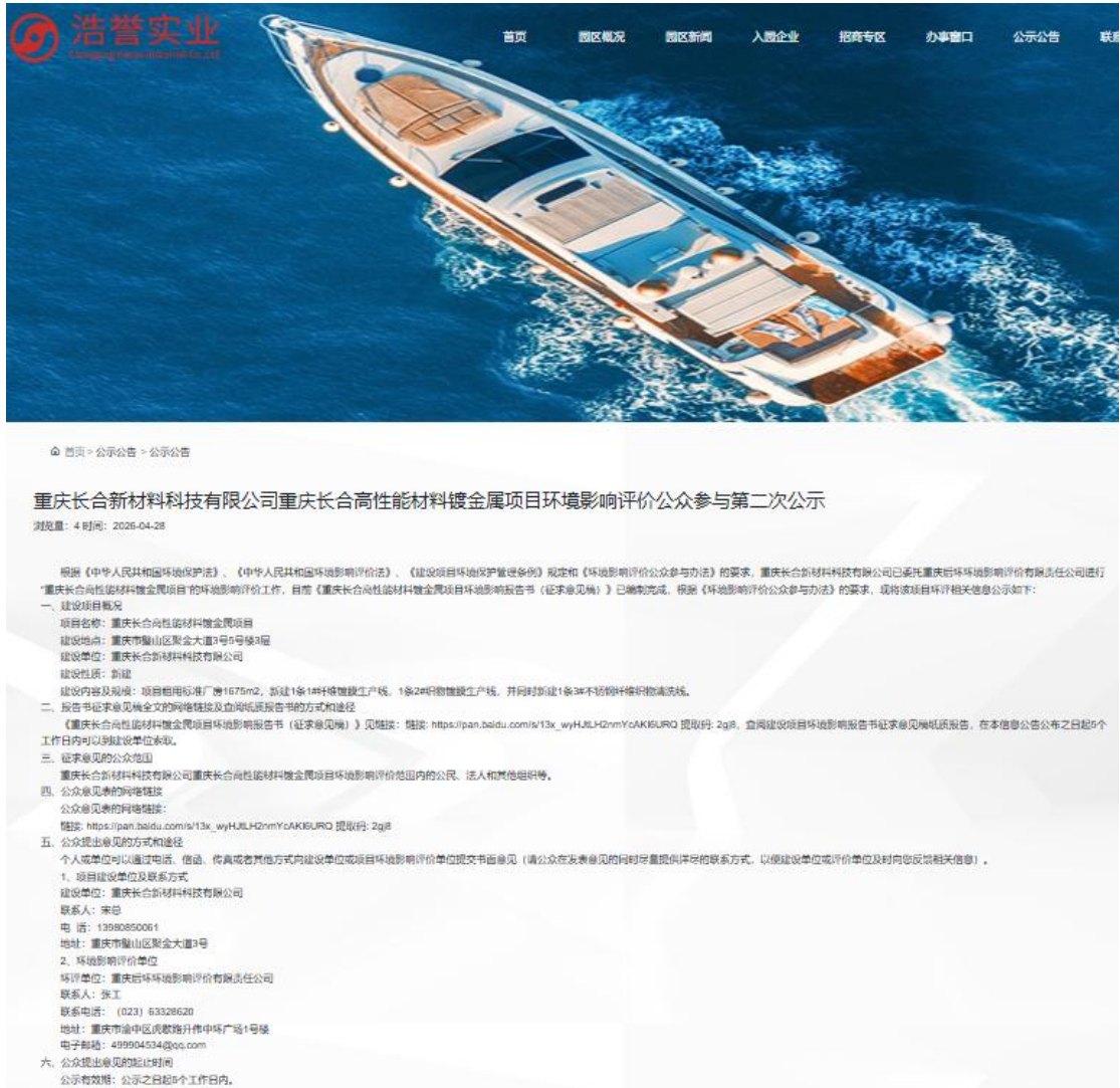
图 3.2-1 公众参与信息第二次公示网页截图