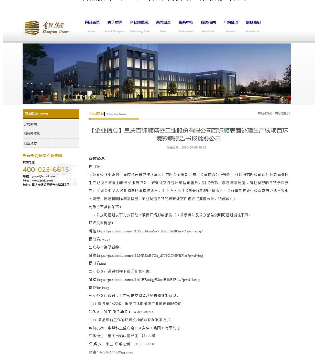
图 5-1 项目环境影响报告书（报批前公示）网上公示截图