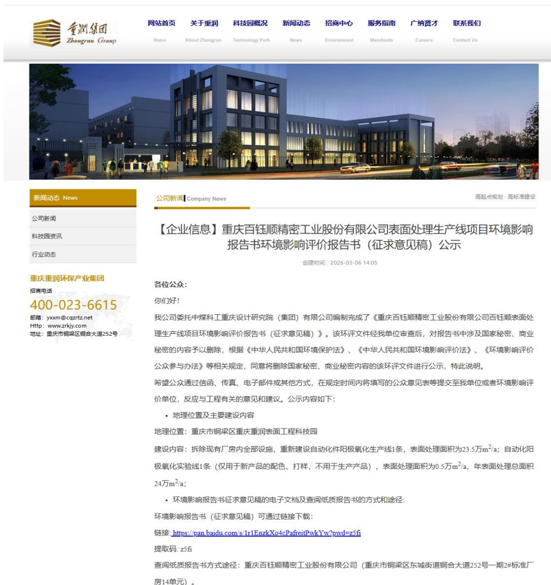
图 2-1 征求意见稿网上公示截图