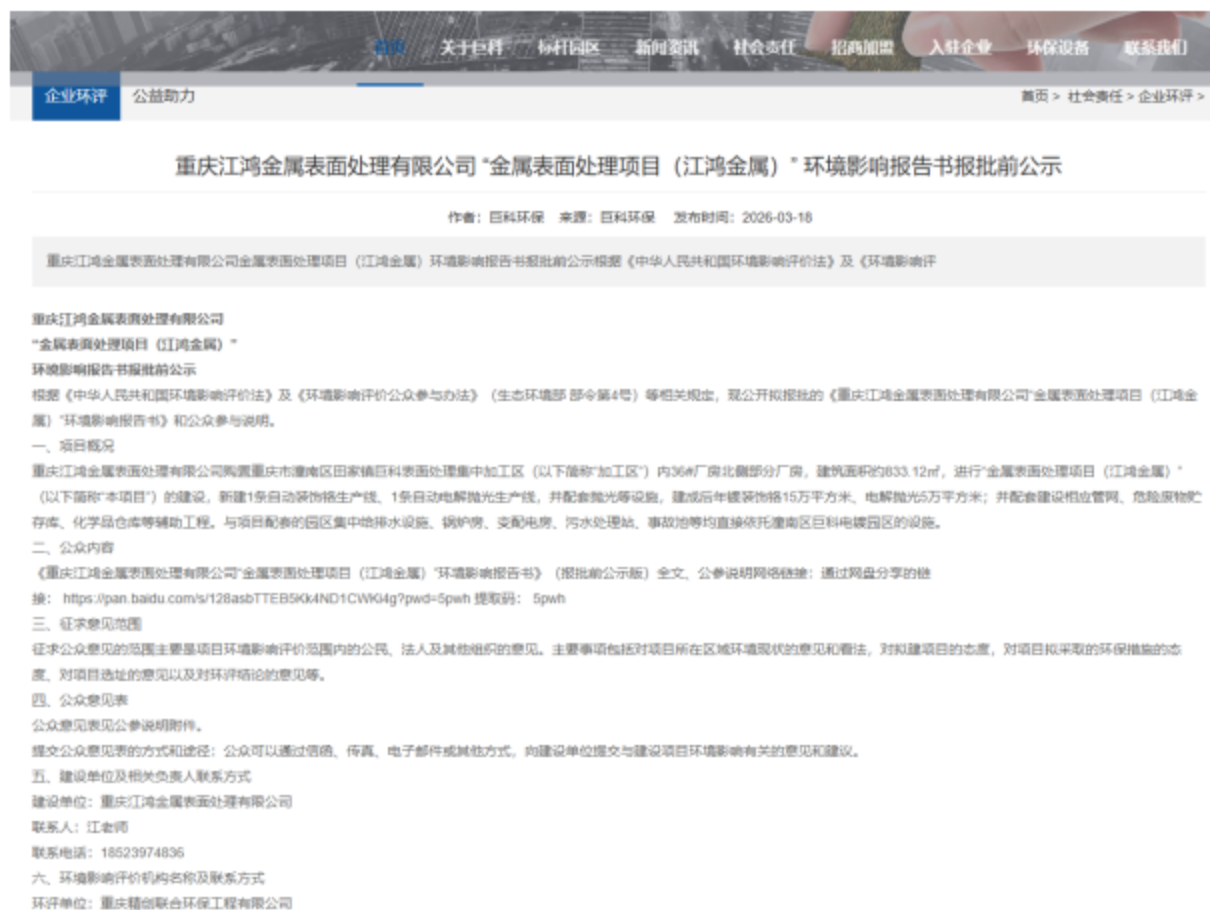
图 3-5 报批前公示截图

公示载体为“重庆巨科环保有限公司”网站，该网站为建设单位官方网站，网址为 http://www.cqjkhb.com/index.php?m=content&c=index&a=show&catid=60&id=264 ，公示时间为 2026 年 3 月 18 日。公示截图如下：