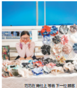
文文在摊位上等待下一位顾客