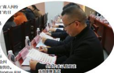
永川法院法官定期到商会提供司法服务