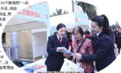
“检小格”普法团队向群众普法

“‘检小格’不仅是一个品牌的‘练兵场’。”永川区检察院负责人介绍,35名青年干警下