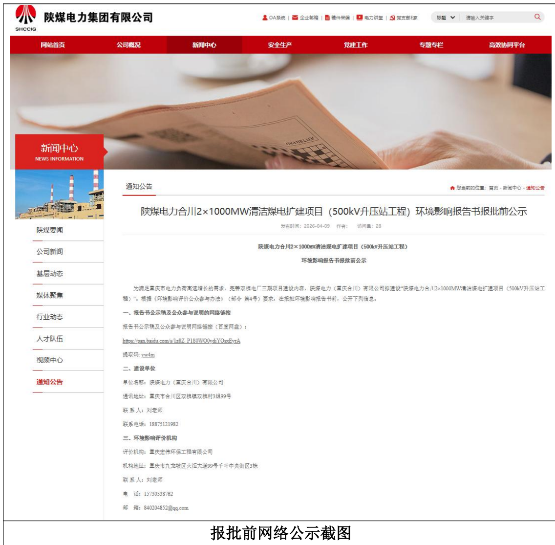
报批前网络公示截图