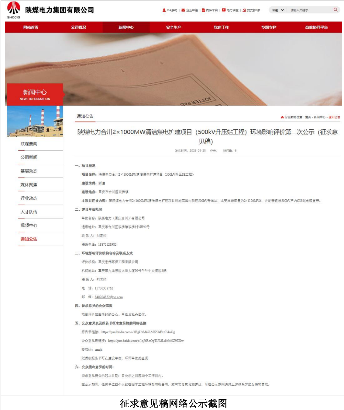
征求意见稿网络公示截图