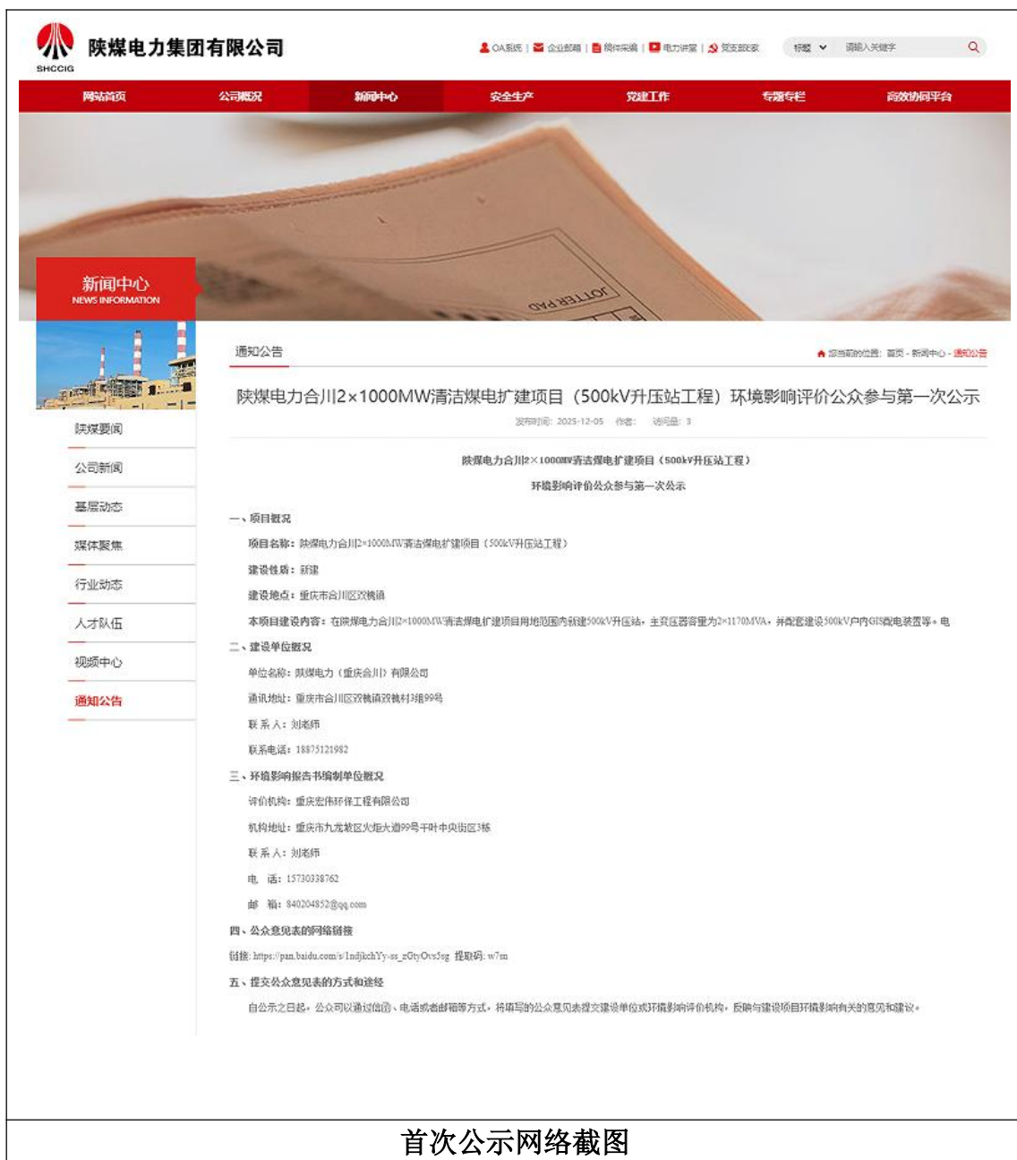
首次公示网络截图