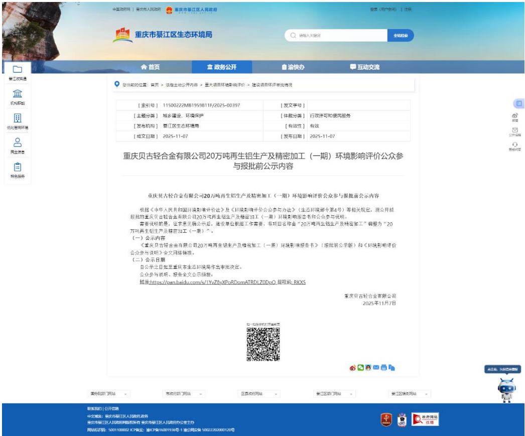
图 6 报批前公示截图