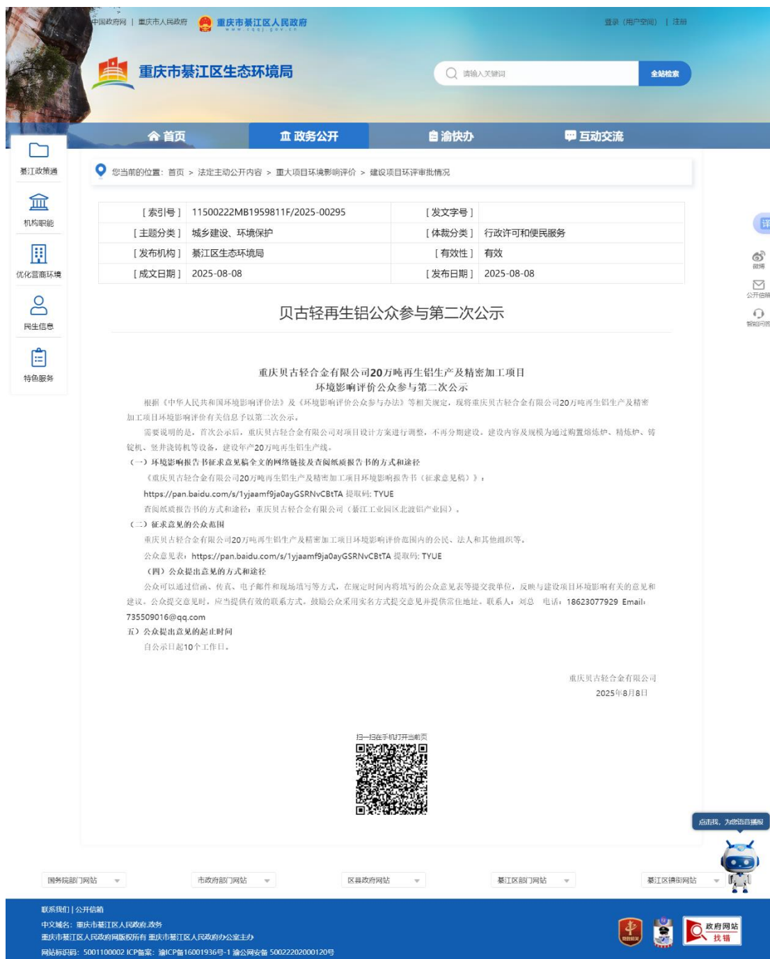
图 2 征求意见稿网络公示截图