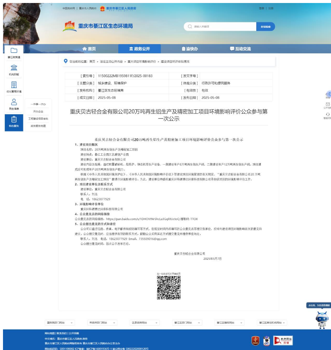
图 1 首次网上公示截图