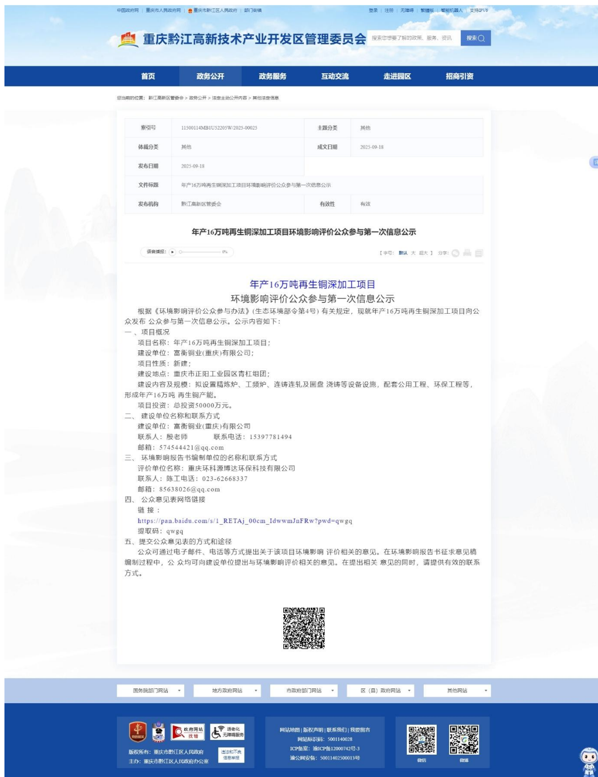
图 1 第一次网络公示截图