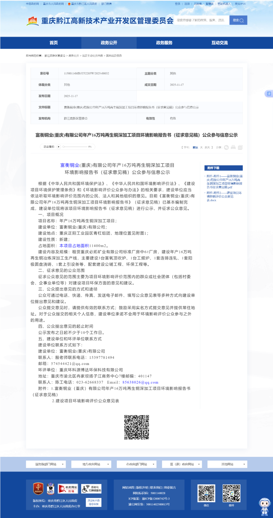
图 2 第二次网络公示截图