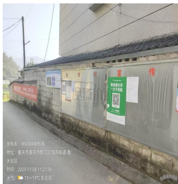
图 5 香水社区张贴照片（17 日、28 日）