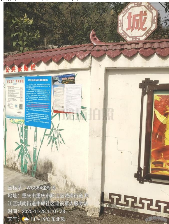
图 6 牛郎社区张贴照片（17 日、28 日）