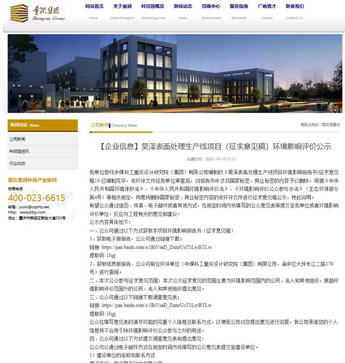
图 2-1 网上公示截图