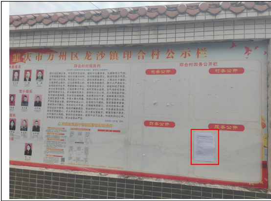
龙沙镇印合村村委会公示栏处