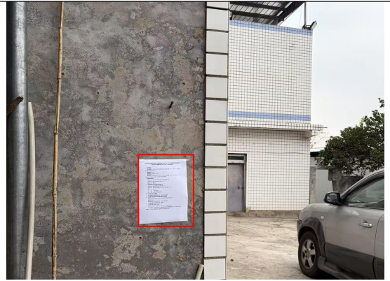
甘宁镇新农村民房处