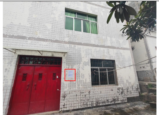
甘宁镇黑马村民房处