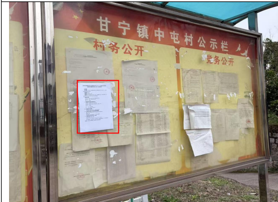
甘宁镇中屯村村委会公示栏处