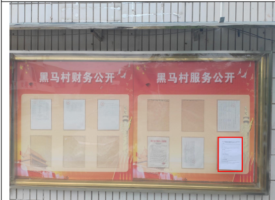
甘宁镇黑马村村委会公示栏处