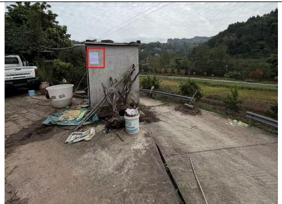
甘宁镇中屯村民房处