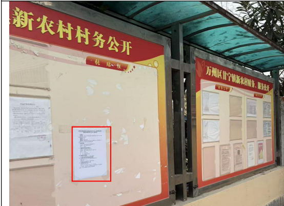
甘宁镇新农村村委会公示栏处