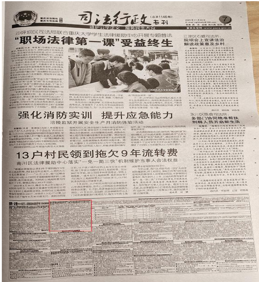
图3 刊报公示（2025年11月24日）