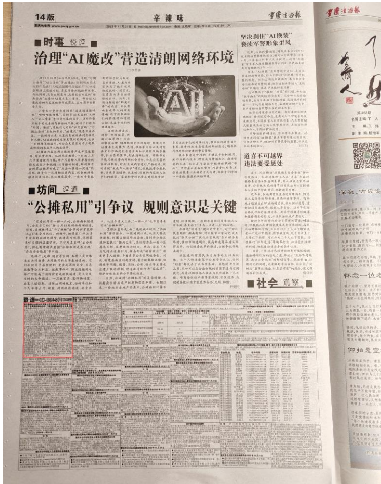
图 3 刊报公示（2025 年 11 月 21 日）