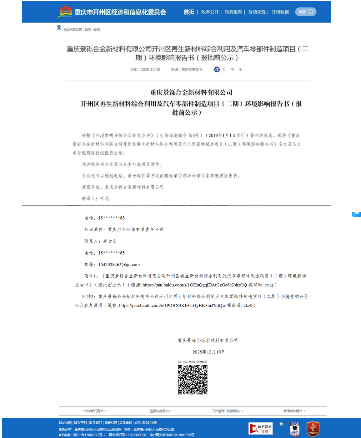
图 4 报批前公示截图（2025 年 12 月 10 日）

本项目未采取深度公众参与。建设单位和环评单位在公示期间未收到公众对项目的质疑性意见。