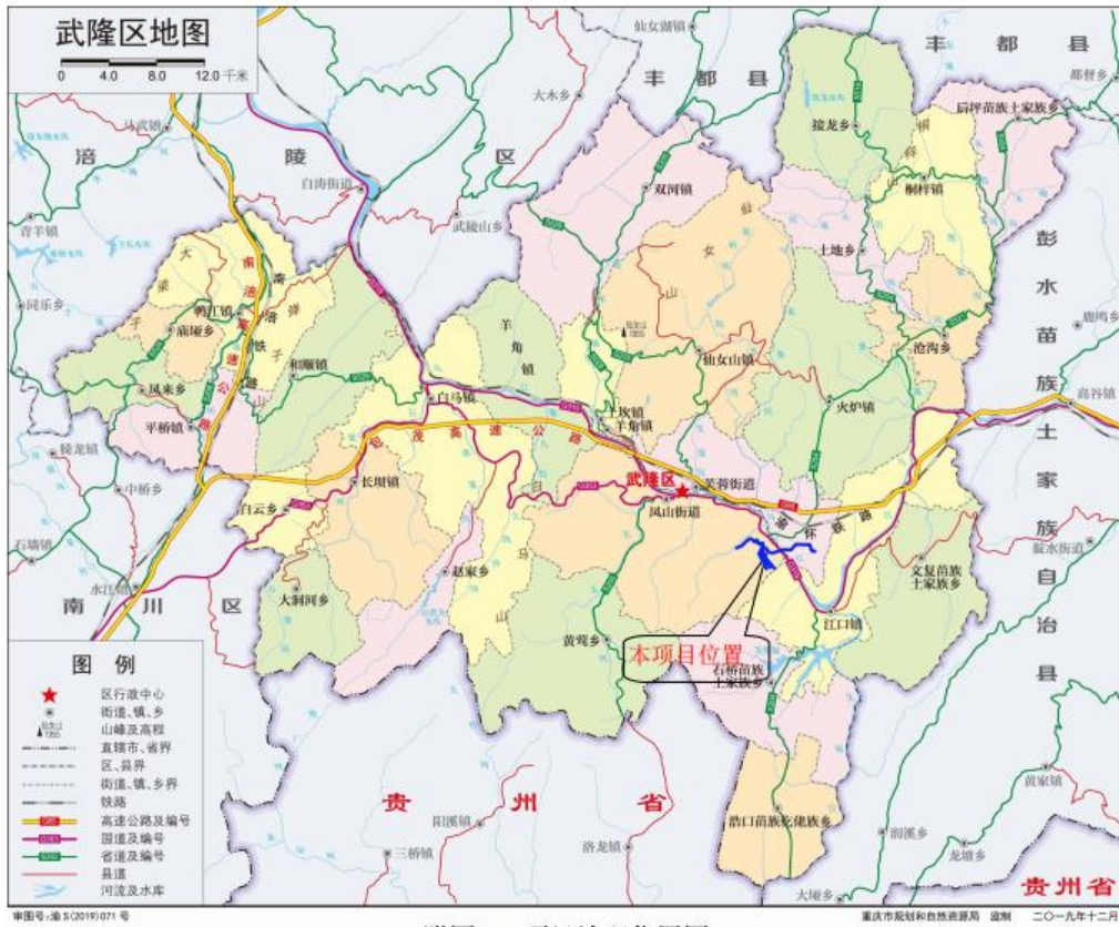
附图1 项目地理位置图