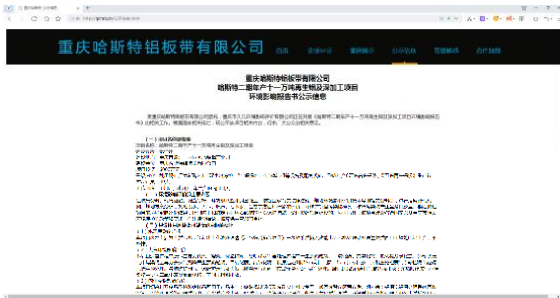
图 3.2-1 环境影响报告书征求意见稿公示截屏