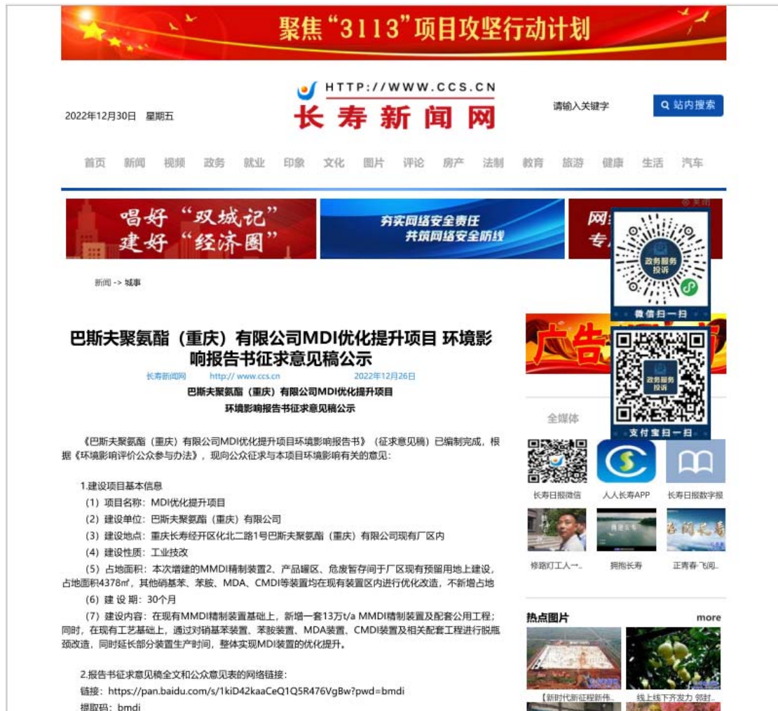
图 3.2-1 环境影响报告书征求意见稿公示截屏