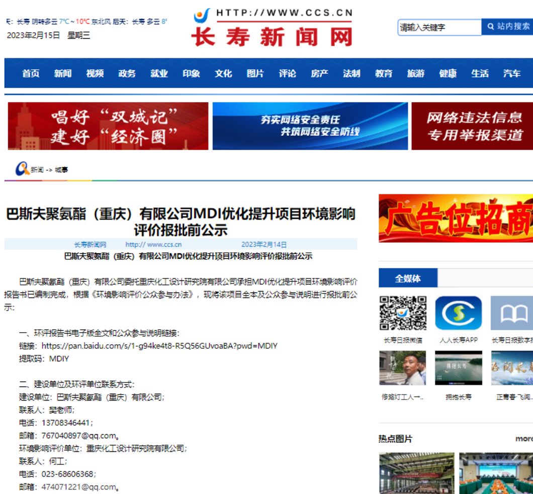
图 5.2-1 项目报批前公示截图