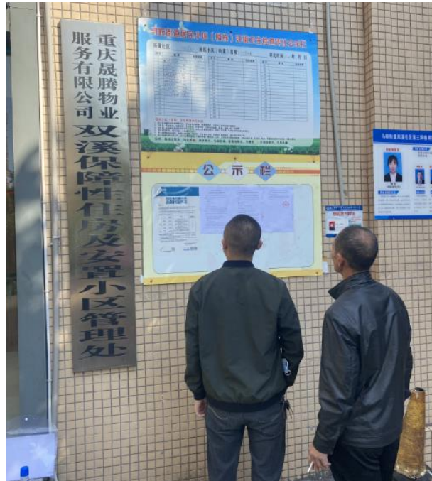
图 3.2.3-1 第二次公示现场（双溪公租房）张贴公示（2022 年 10 月 17 日张贴）