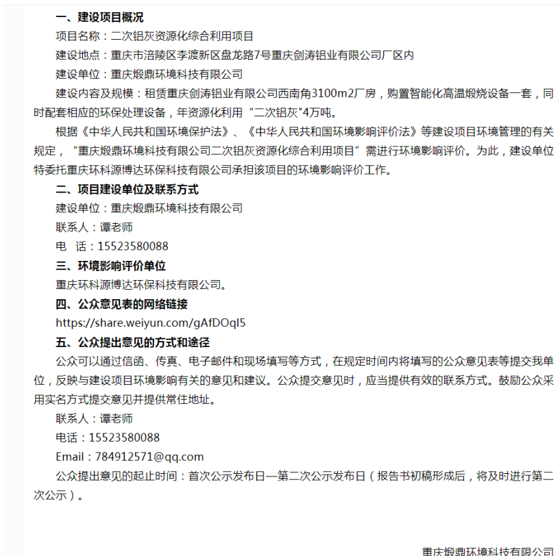
图 2.2.1-1 第一次网络公示截图

载体选取符合性分析：建设单位选取涪陵区人民政府网站（ http://www.fl.gov.cn/zwxw_206/gsgg/202205/t20220517_10725230.html ）进行第一次公示，该网站备案证号：渝 ICP 备 20007872 号，为符合要求的正规公开网站，符合《环境影响评价公众参与办法》（生态环境部令第 4 号）相关要求。