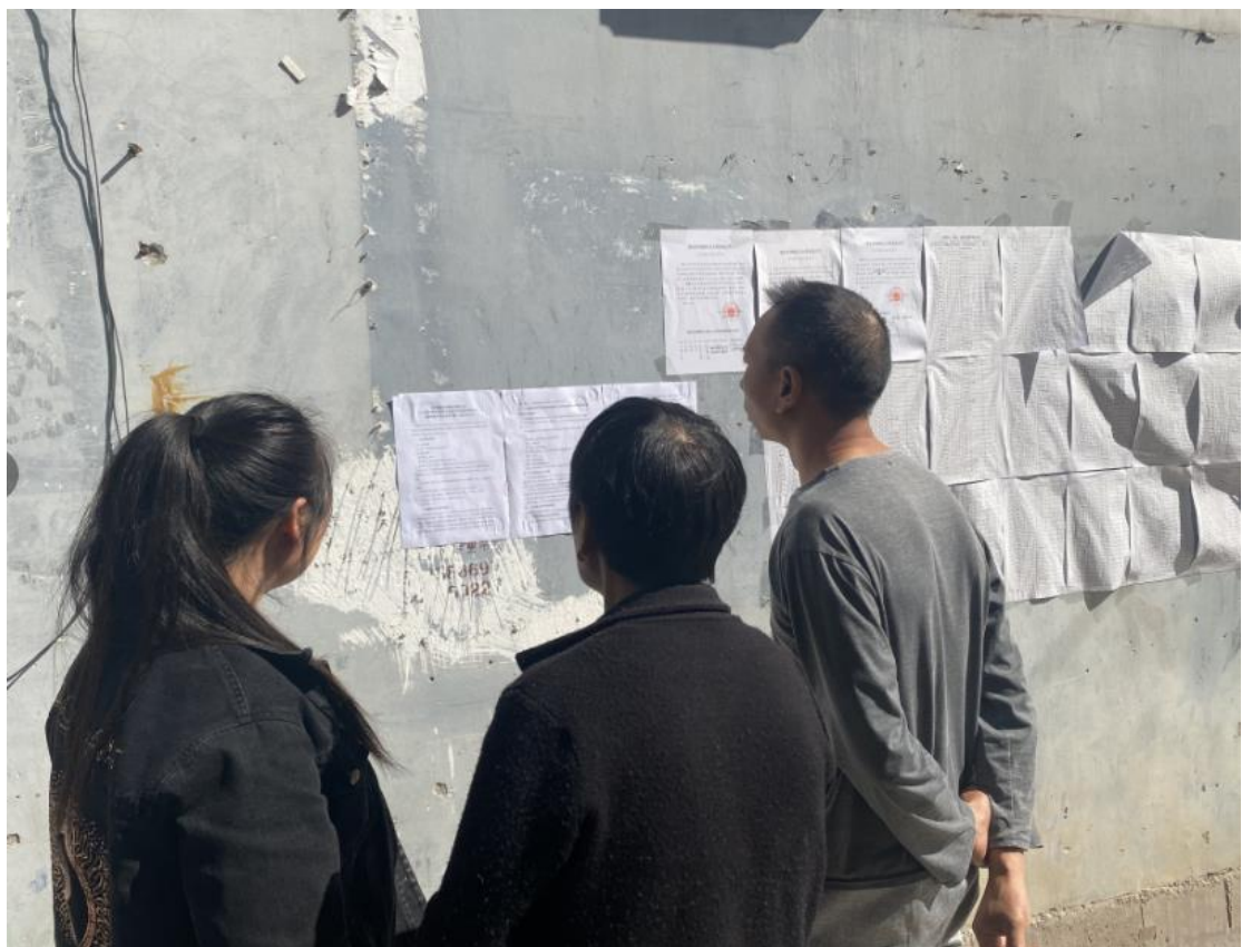
图 3.2.3-4 第二次公示现场（义和镇）张贴公示（2022 年 10 月 17 日张贴）