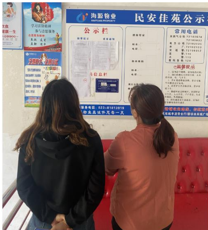
图 3.2.3-3 第二次公示现场（民安佳苑）张贴公示（2022 年 10 月 17 日张贴）