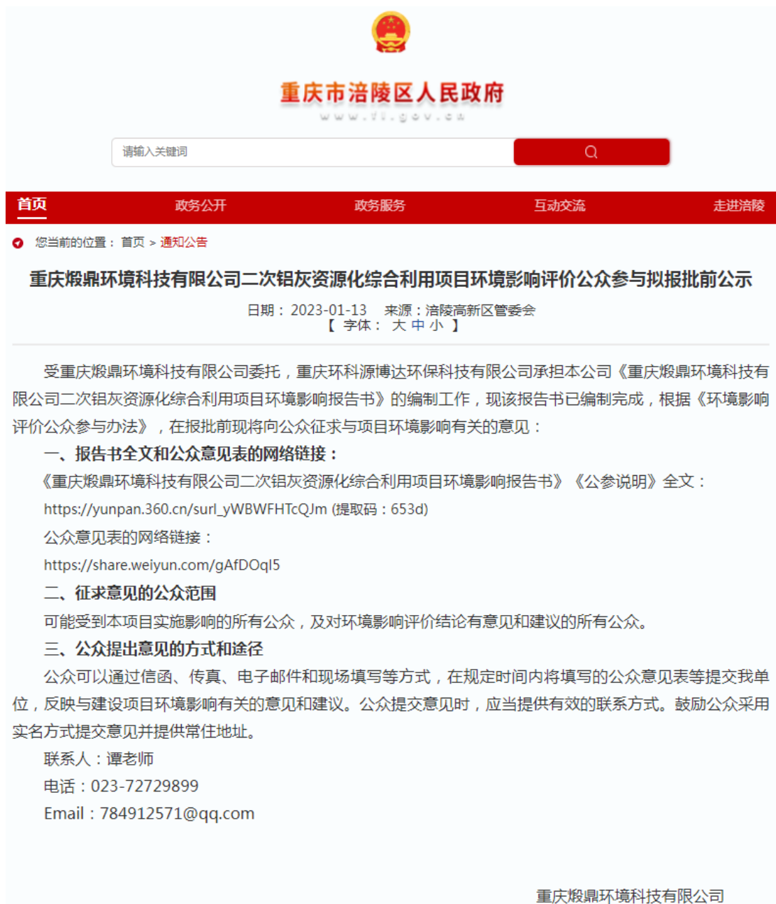
图 6.2.1-1 拟报批前网络公示截图