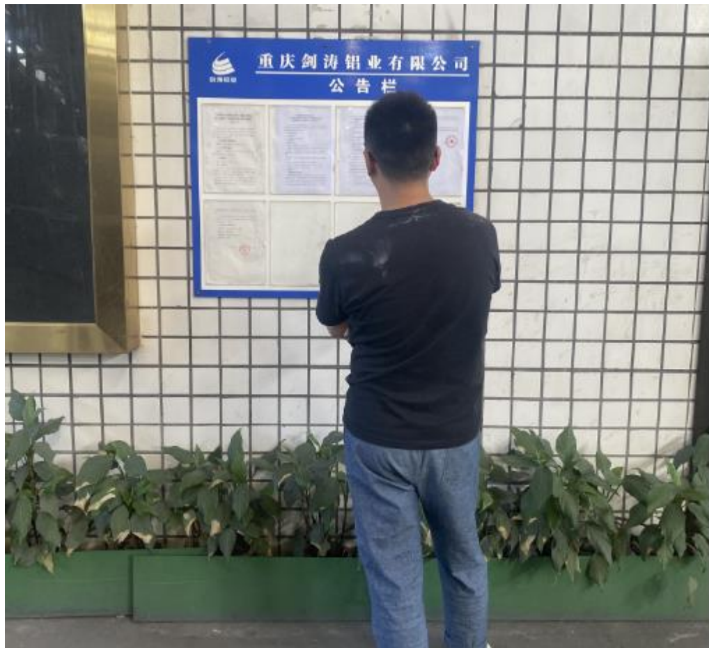
图 3.2.3-2 第二次公示现场（剑涛铝业厂区）张贴公示（2022 年 10 月 17 日张贴）