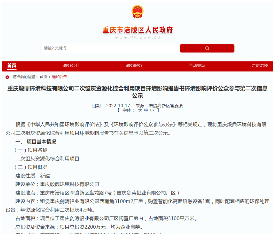
图 3.2.1-1 第二次网络公示截图