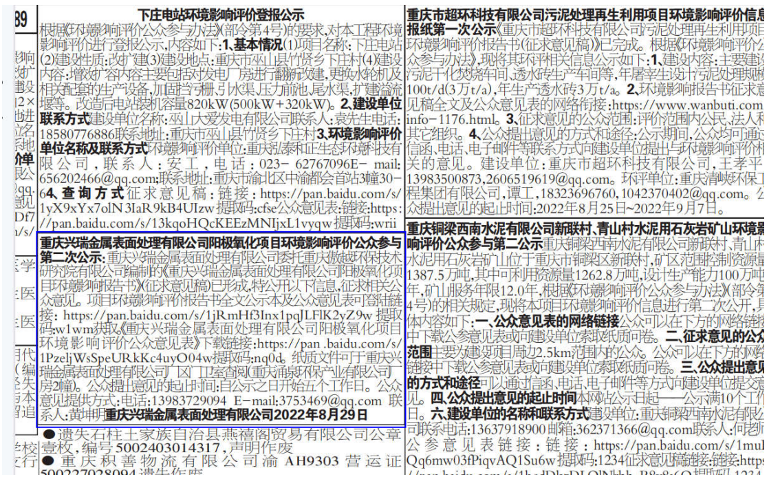
图 3.2-2 2022 年 8 月 29 日环评信息报纸公示照片