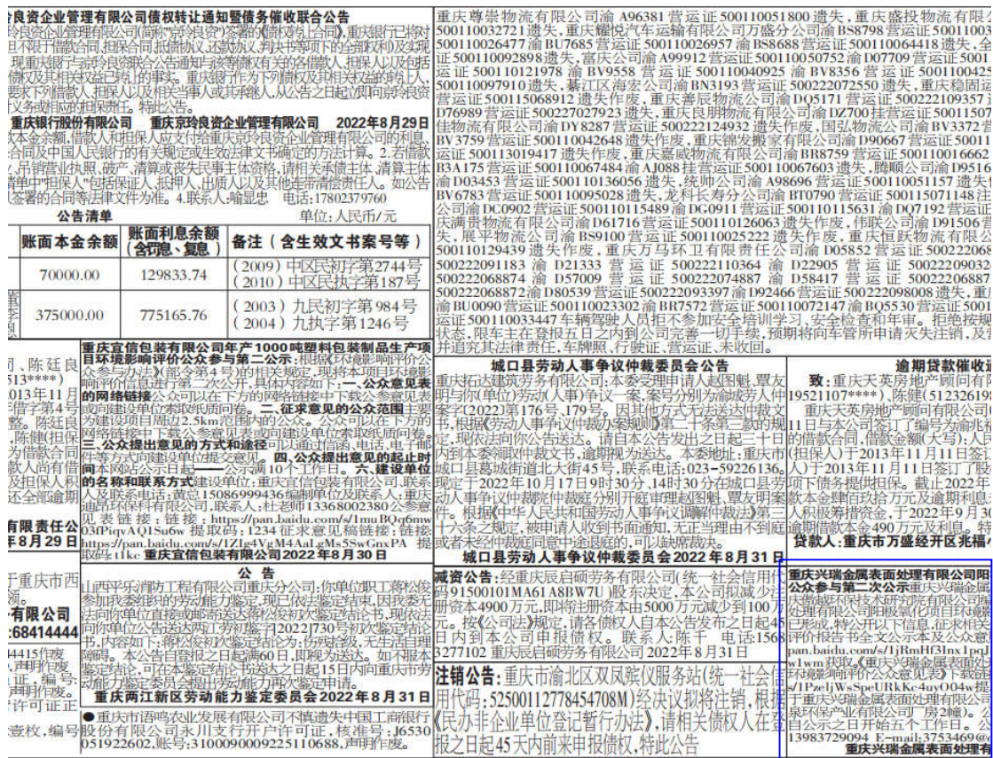
图 3.2-3 2022 年 8 月 31 日环评信息报纸公示照片