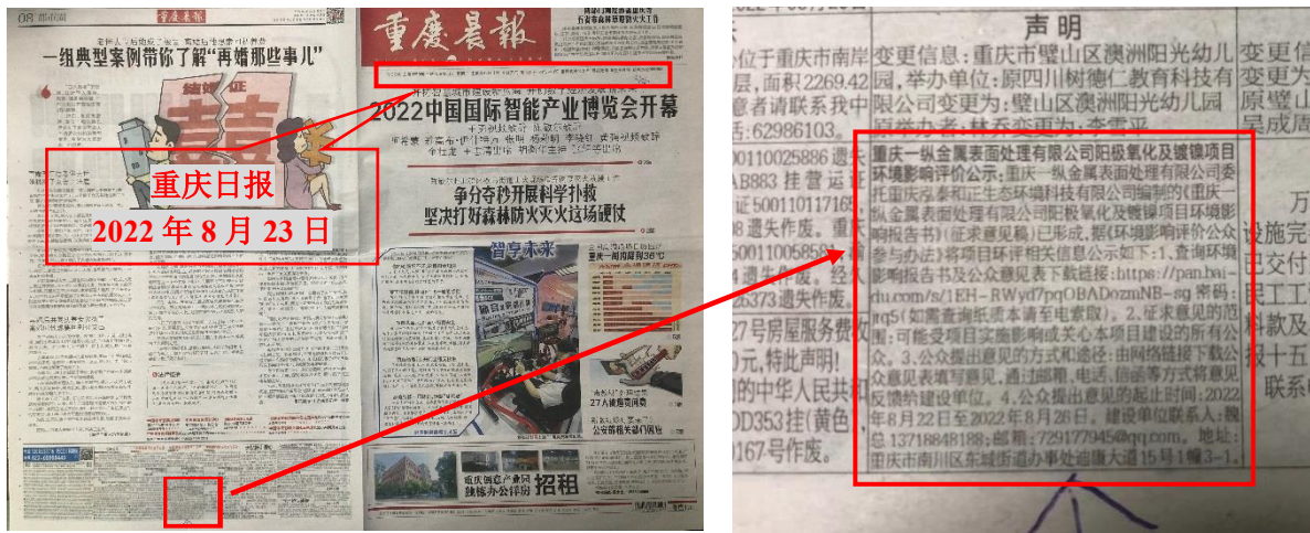
图 1.2.2-1 2022 年 8 月 23 日报纸公示照片（第一次）

载体选取的符合性分析：重庆日是中共重庆市委机关报，1952 年 8 月 5 日创刊；是中共重庆市委、市政府的喉舌，是重庆地区发行量最大、辐射面最广、权威性最强的综合性城市党报，是中国大西南新闻信息传播中心、广告发布制作中心、报刊出版印务中心。该报纸为建设项目所在地公众易于接触的报纸，符合《环境影响评价公众参与办法》要求。