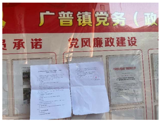
图 3.2-4 项目沿线街道（镇）处现场张贴图 1