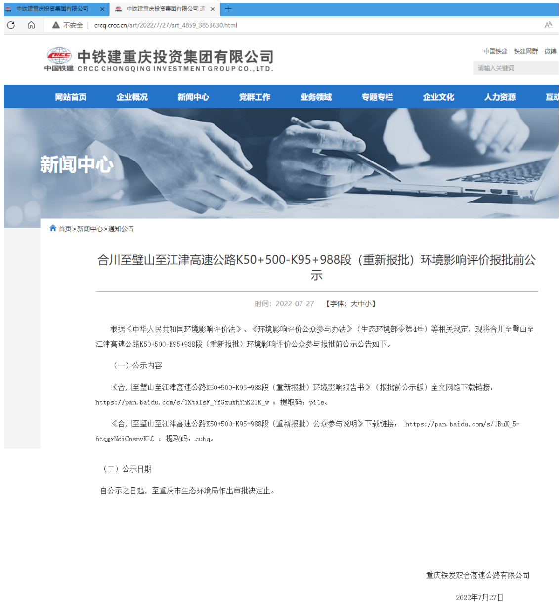
图 6.2-1 报批前网络公示截图

载体选取符合性分析：中铁建重庆投资集团有限公司是建设单位上级公司，属于建设单位网站，因此公示载体的选取符合《环境影响评价公众参与办法》（生态环境部令第4号）要求。