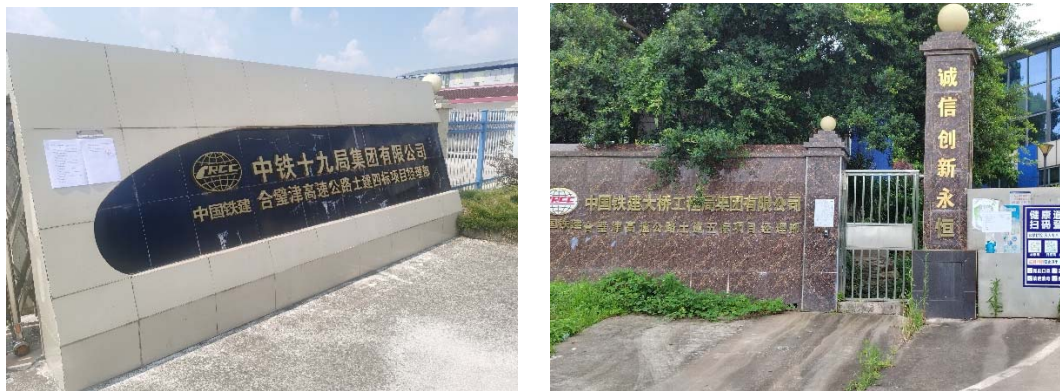
图 3.2-6 项目沿线项目部现场张贴图