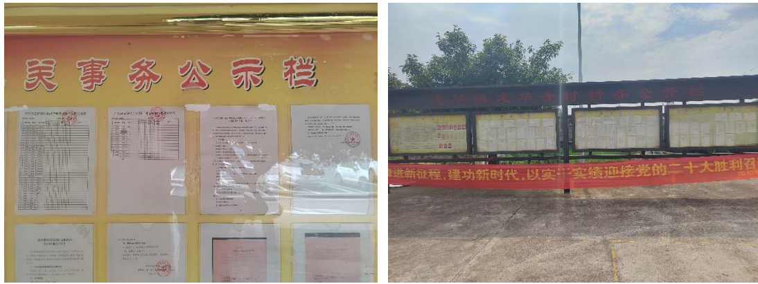
图 3.2-5 项目沿线街道（镇）处现场张贴图 2