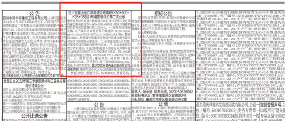
图 3.2-3 第二次报纸公示