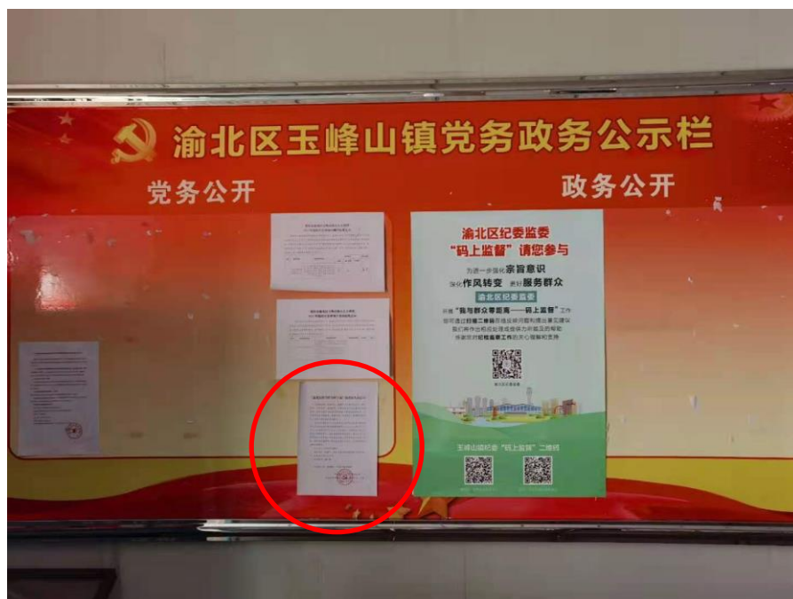
渝北区玉峰山镇政府公示栏