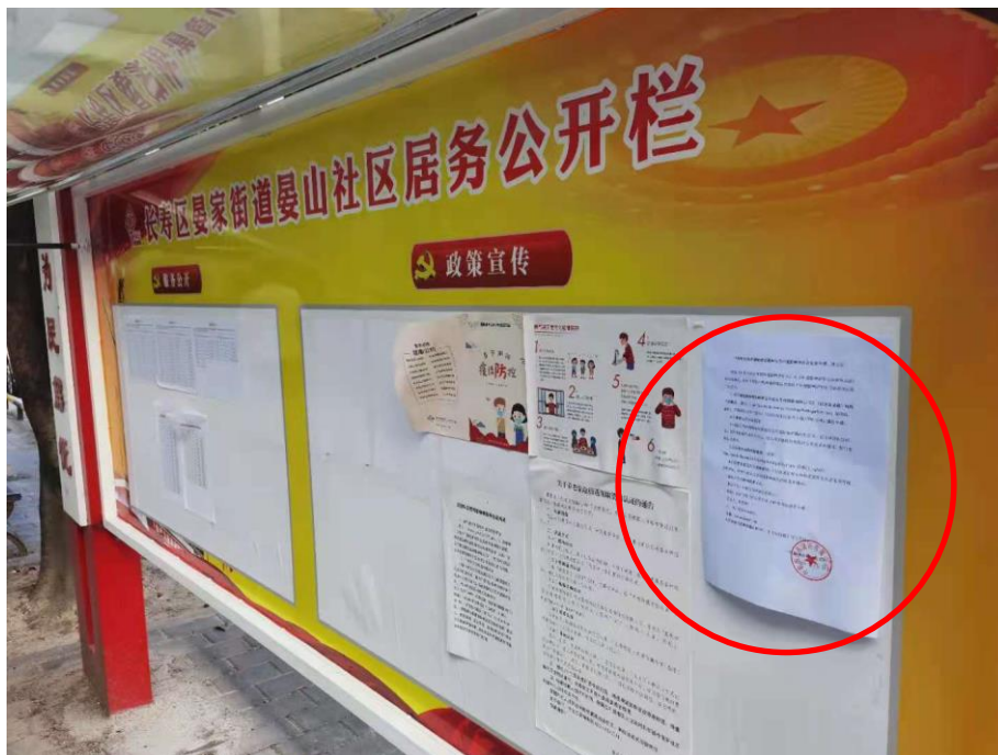
晏家街道晏家社区居委会

建设单位于 2021 年 7 月 19 日~8 月 2 日期间在工程沿线群众易于接触的村委、街道公告栏张贴相关信息，张贴公示满足 10 个工作日要求。