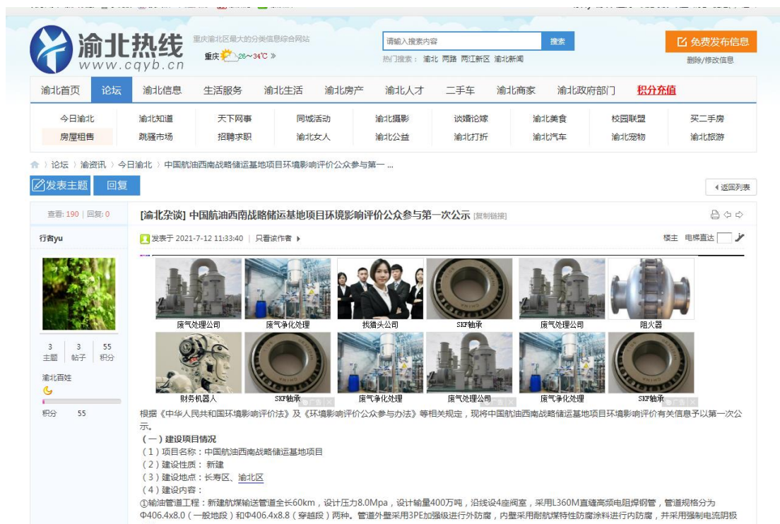
图 1 渝北热线第一次网络公示图片