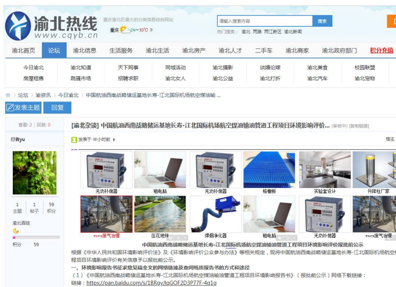
图 6 渝北热线报批网络公示图片

建设单位于 2021 年 8 月 31 日起在渝北热线、长寿湖山在线( http://www.cs53.com/news/newsshow-2363.html )进行了网络公示。公示载体符合《环境影响评价公众参与办法》的相关要求。