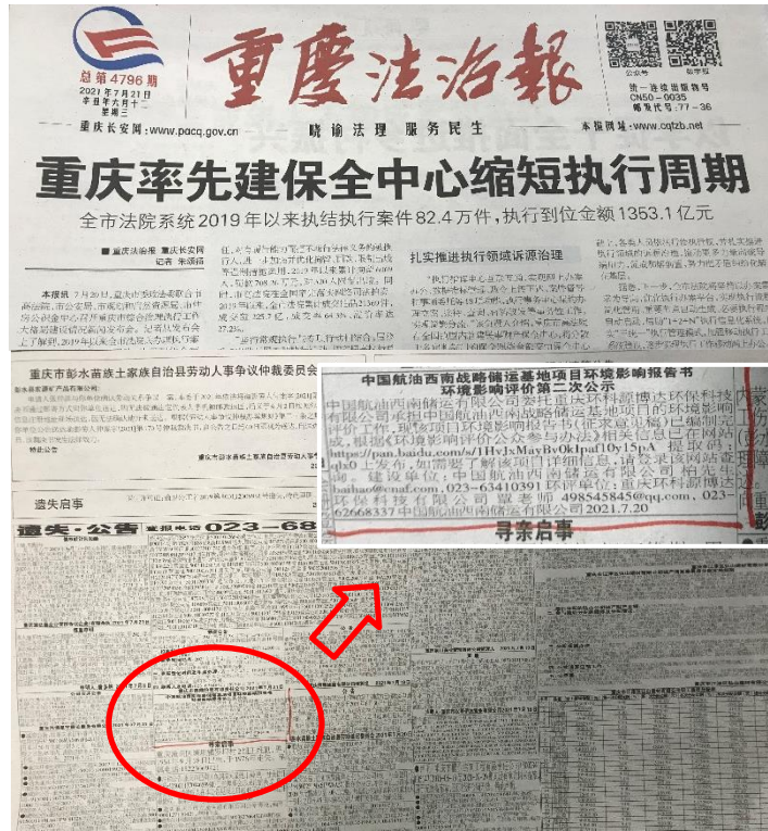
图 4 征求意见稿第一次报纸公示