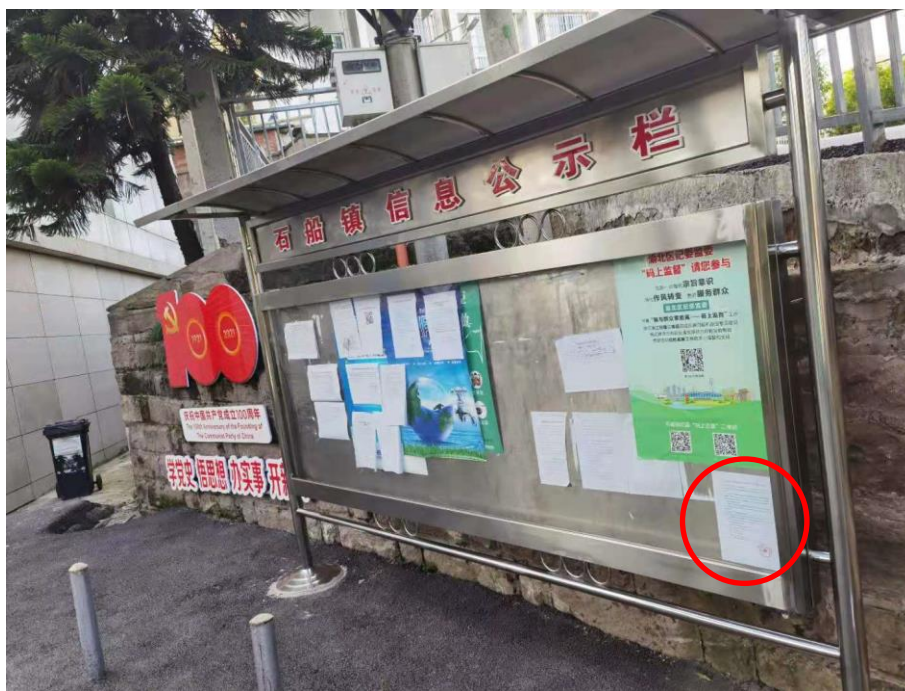
渝北区石船镇政府公示栏