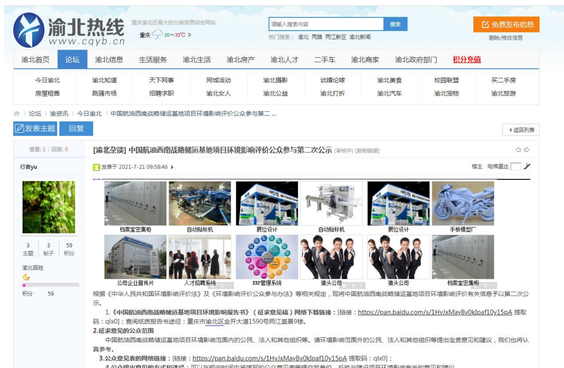
图 3 渝北热线征求意见稿网络公示图片

建设单位于 2021 年 7 月 19 日起在渝北热线、长寿湖山在线( http://www.cs53.com/news/newsshow-2357.html ) 进行了公示，公示时间自 2021 年 7 月 19 日起不少于 10 个工作日。