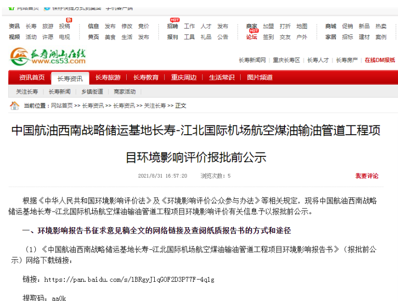
图 7 长寿湖山在线报批网络公示图片