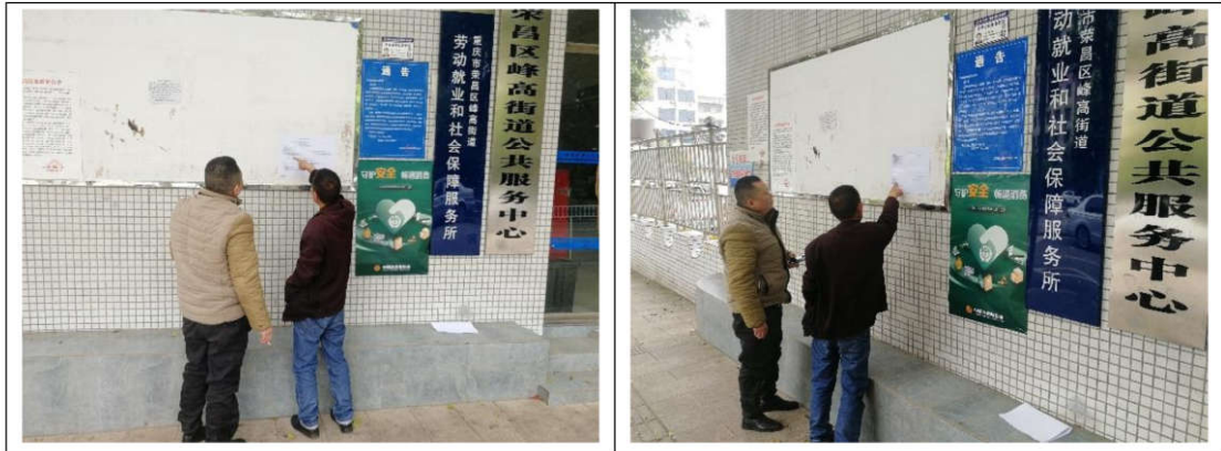
峰高街道公示情况