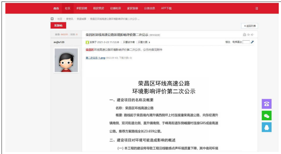
图 3.2-1 第二次网络公示截图