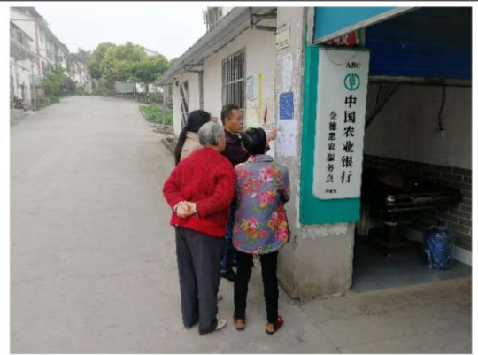
双河街道鱼苗产业社区鱼苗新村公示情况