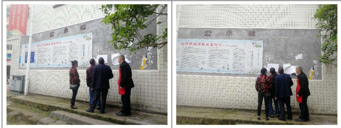
清升镇现场公示情况

2021年3月，在建设项目征求意见稿编制完成后，为使项目所在地的公众更好的了解项目，建设单位在沿线居民较为集中的村庄张贴公示，张贴公司内容与第二次公示内容一致，现场张贴公示照片见图 3.2-4。