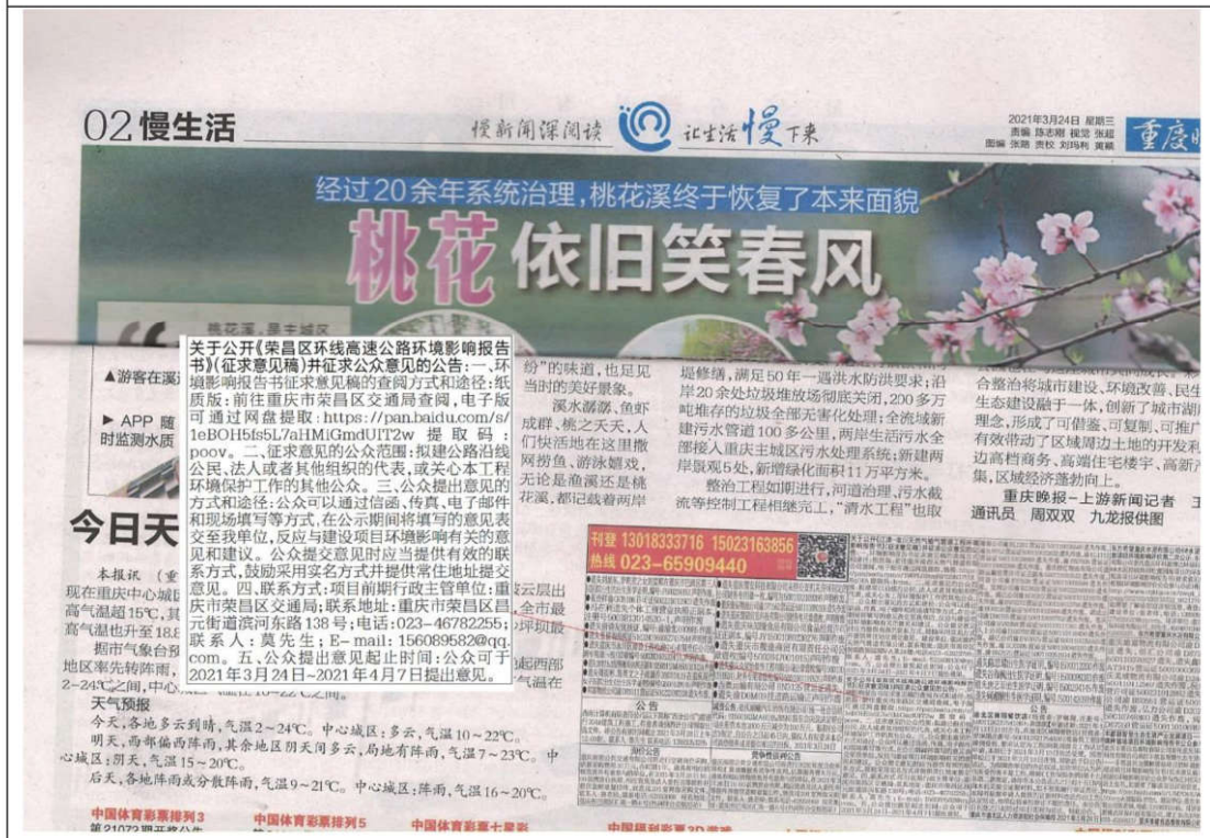
图 3.2-2 3 月 24 日报纸公示