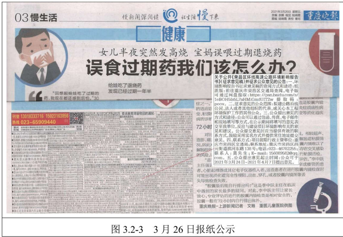
图 3.2-3 3月26日报纸公示