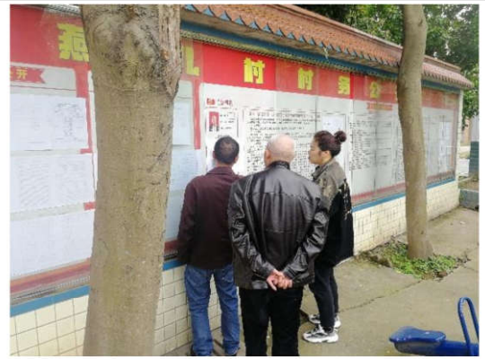
直升镇燕儿村公示情况