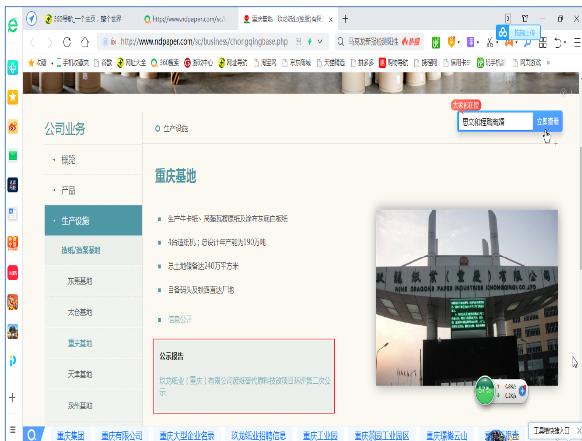
图 2-1 征求意见稿网络公示截图

建设单位于 2020 年 12 月 16 日起在玖龙纸业控股有限公司网站公示栏（网络链接： http://www.ndpaper.com/sc/business/chongqingbase.php ）进行第二次征求意见稿信息公示。