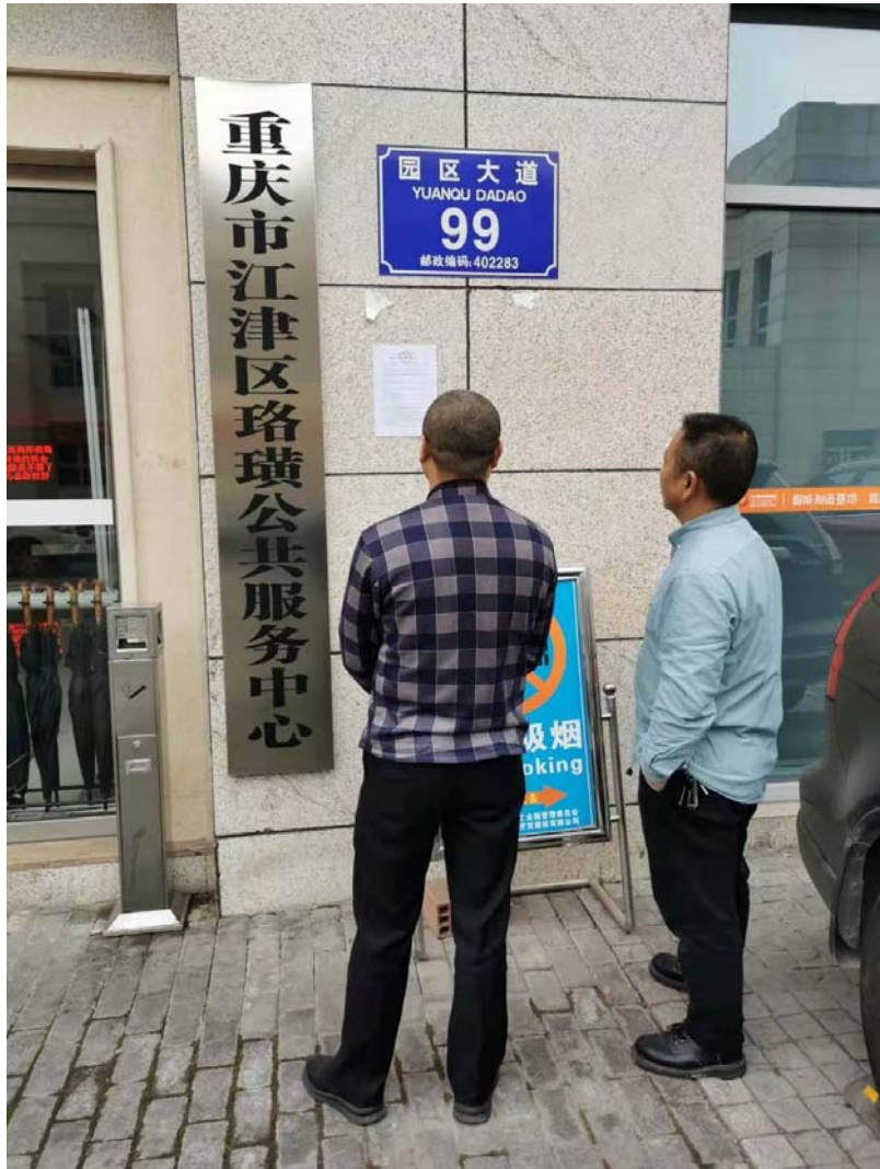
珞璜工业园区管委会（公共服务中心）