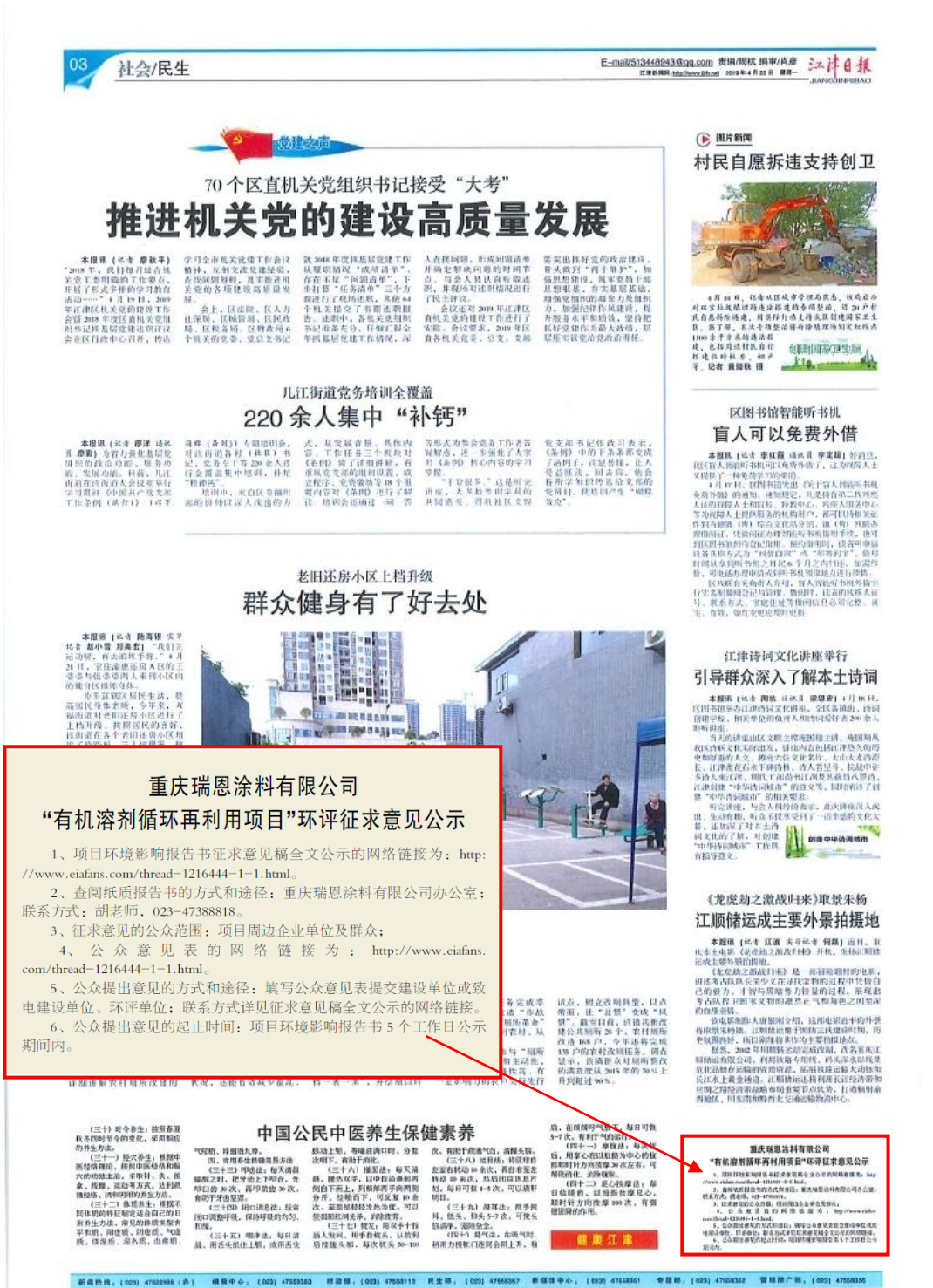
图 3-2 报纸公示截图（4 月 22 日）

项目征求意见稿公示期间，分别约 2019 年 4 月 22 日和 2019 年 4 月 23 日在《江津日报》上进行了信息公告，共计 2 次；符合《环境影响评价公众参与办法》（生态环境部令部令 第 4 号）要求。报纸公示截图见图 3-2、图 3-3。