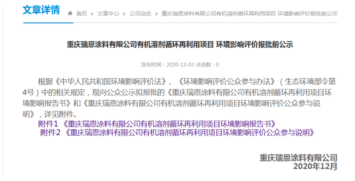
图 3-4 报批前公示截图

项目报批前于 2020 年 12 月 3 日在瑞恩公司网站上进行了网络公示，网络连接为： http://test.cqryan.com/article.php?id=47 ；符合《环境影响评价公众参与办法》（生态环境部令部令 第 4 号）要求。公示截图见图 3-4。