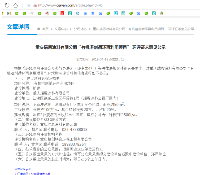
图 3-1 网络公示截图(征求意见稿公示)

http://www.cqryan.com/article.php?id=45 (瑞恩公司网站), 符合《环境影响评价公众参与办法》(生态环境部令部令 第4号)要求。公示截图见图3-1。