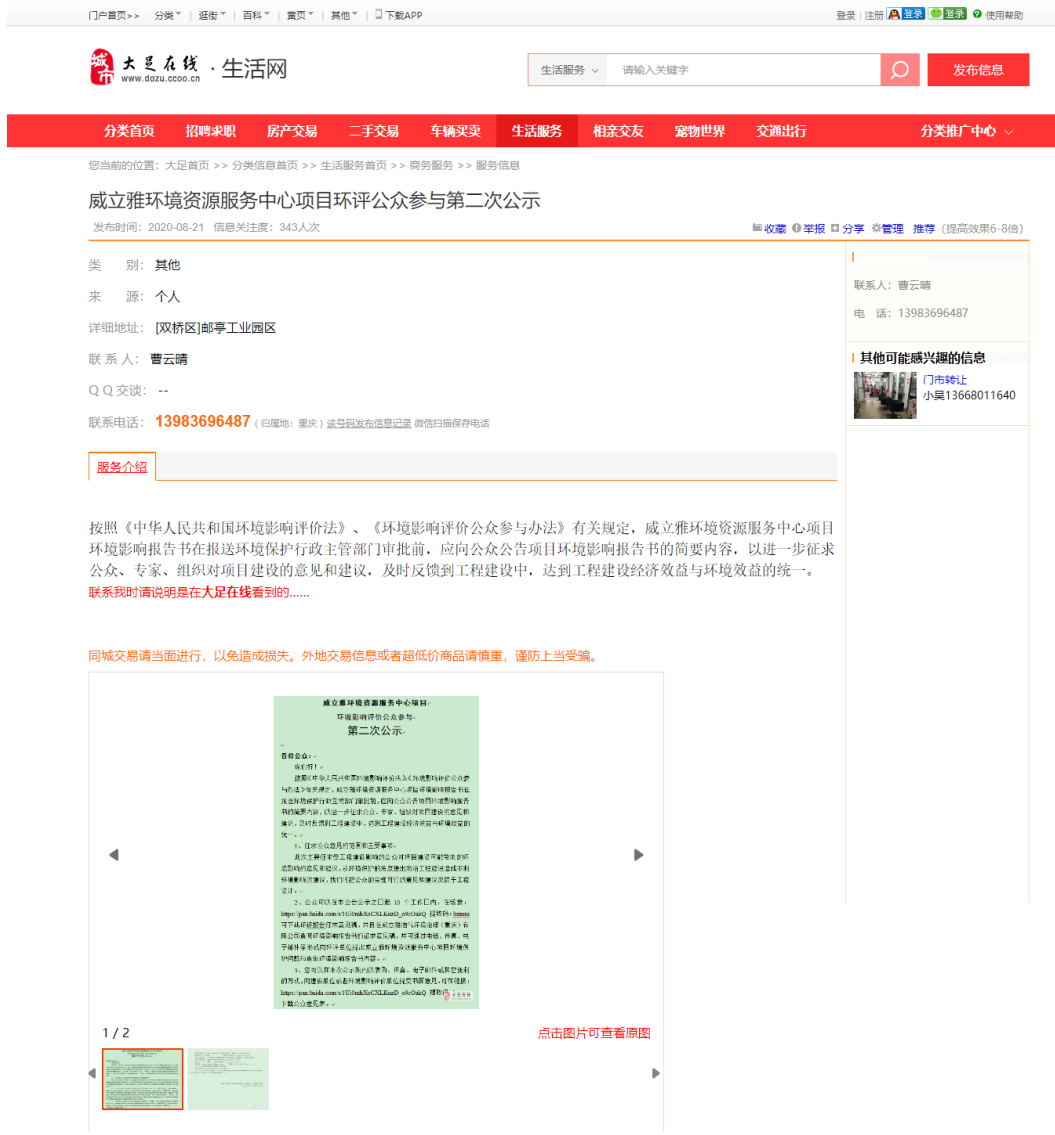
图 2-1 征求意见稿网上公示截图