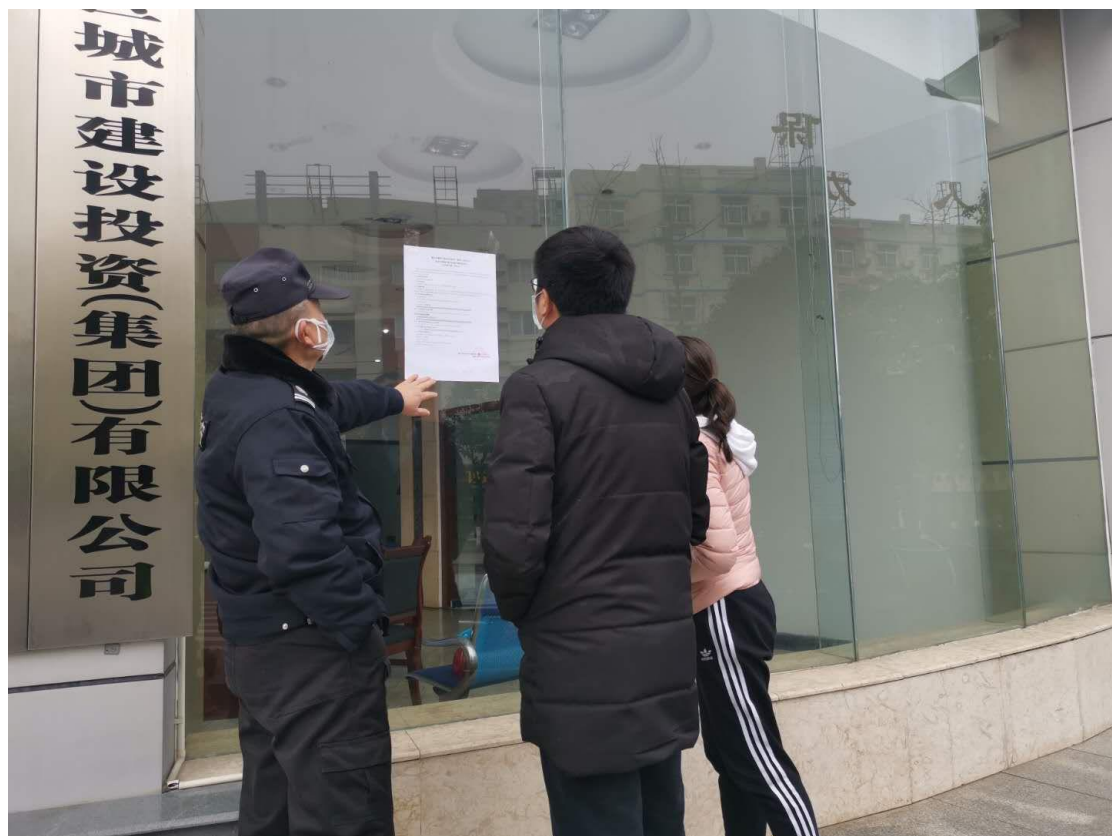
图 3.2—4 公告公示现场照片

建设单位于 2020 年 2 月 24 日~2020 年 3 月 6 日在重庆市潼南区城市建设投资（集团）有限公司通过公告方式进行了公示，现场照片见图 3.2—4~3.2—7。