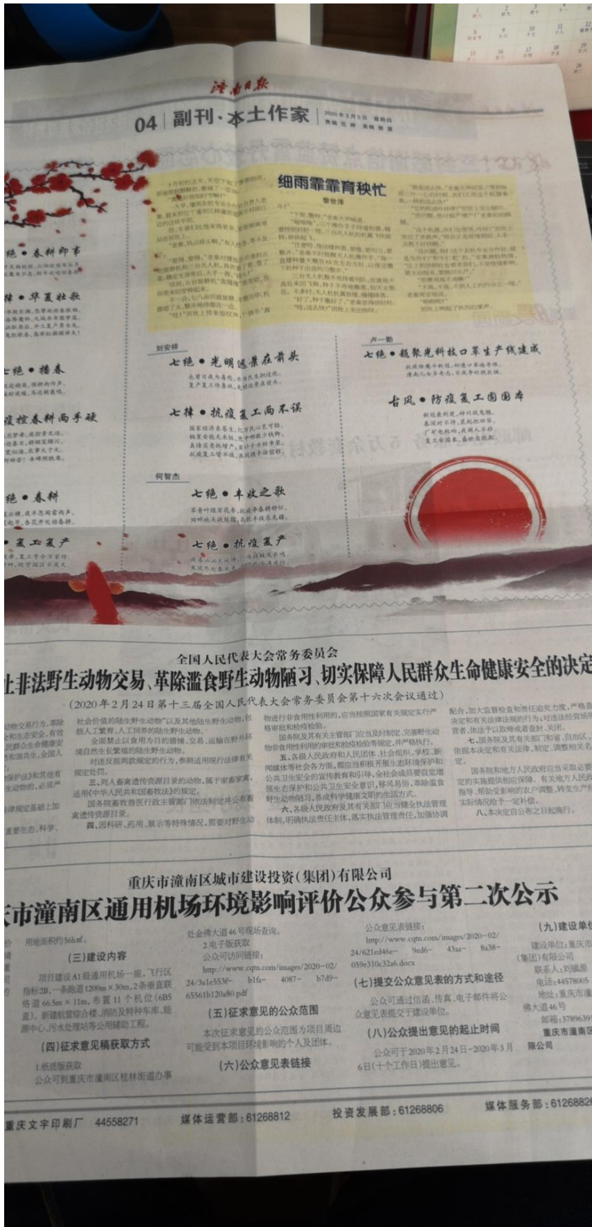
图 3.2—3 报纸公示照片（2020 年 3 月 5 日）