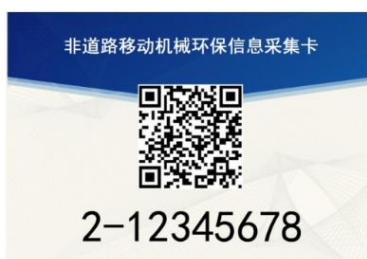
图 2 采集卡正面样式