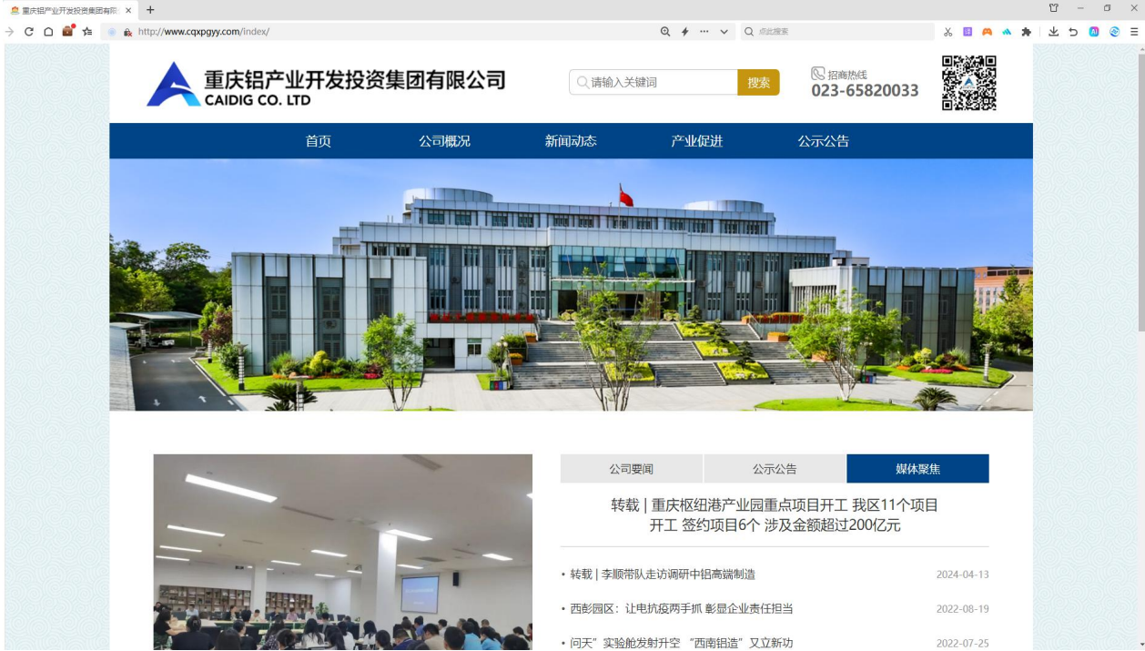
重庆铝产业开发投资集团有限公司官网首页截图

建设单位重庆同益电力科技有限公司于2024年2月19日在重庆铝产业开发投资集团有限公司官网（网站链接： http://www.cqxpgy.com/index/ ）“公示公告—招标信息”板块（网站链接： http://www.cqxpgy.com/gsgg/news/2024-2/18_3119.shtml ）进行了首次环境影响评价信息公开，公示时间为2024年2月19日~3月1日，公示截图详见图2-1。