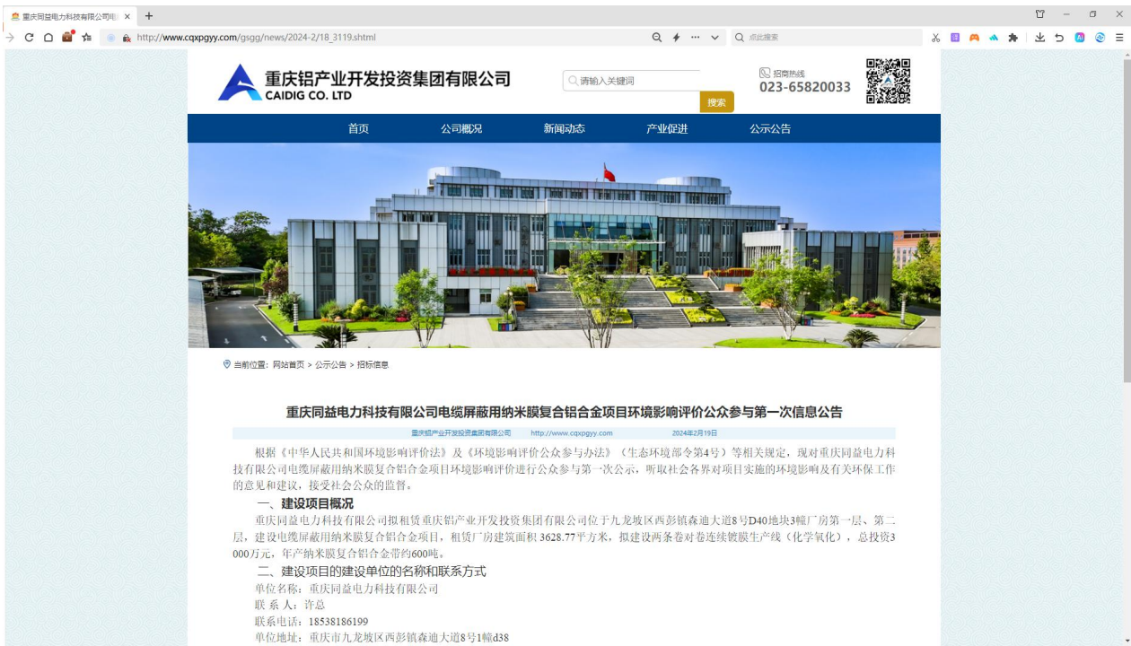
第一次公示内容截图