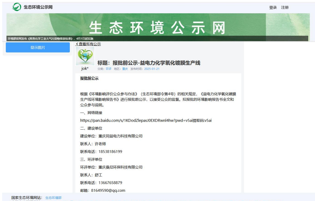
图 6-1 第三次环境影响评价信息公示（网络平台公示）

网络公示时间：2025 年 1 月 21 日，重庆同益电力科技有限公司生态环境公示网（ 网站链接: https://gongshi.qsyhbgj.com/h5public-detail?id=438704 ）。网络公示情况详见图 6-1。