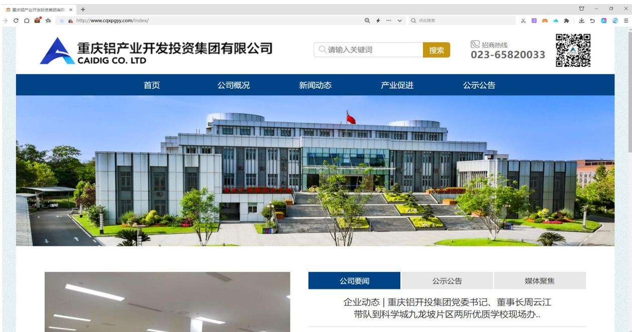
重庆铝产业开发投资集团有限公司官网首页截图