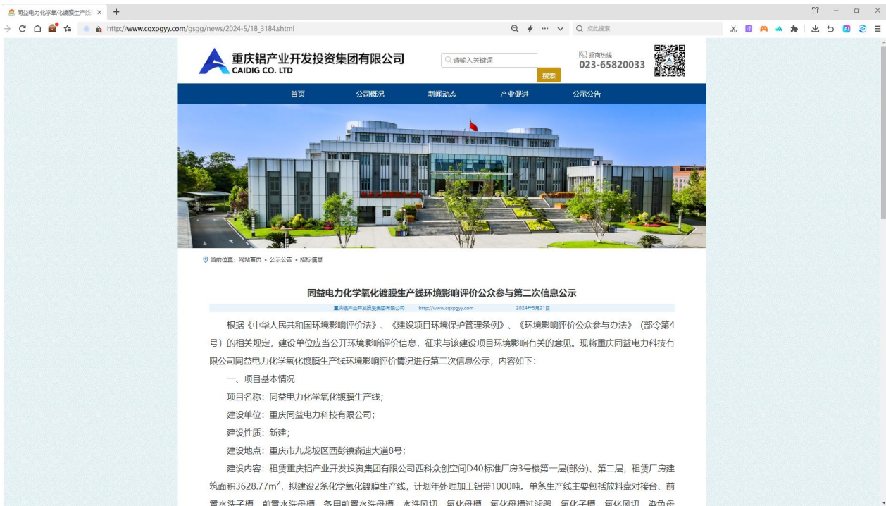
第二次公示内容截图