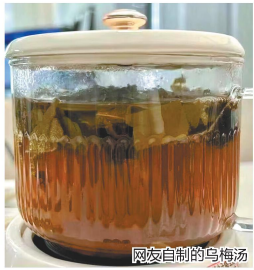
网友自制的乌梅汤

去年夏天,到中医馆开一副乌梅汤受到人们追捧。今年立夏后,加入了荷叶和丹参两味药材,号称能减重的乌梅汤 2.0 版本火了。它不仅销售火爆,有网友每天在网上晒出饮用后的感受,还有人在 2.0 版本配方基础上,又添加了其他药材冠以“3.0 版”。