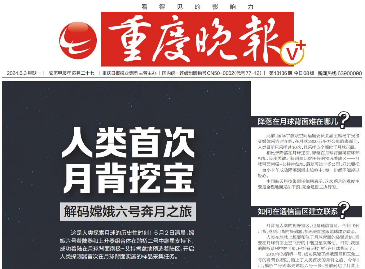
2024年6月3日《重庆晚报》第一版

建设单位分别于2024年6月3日和2024年6月4日在《重庆晚报》上登报进行征求意见稿的公示。本项目征求意见稿报纸公示内容截图详见图3-2。