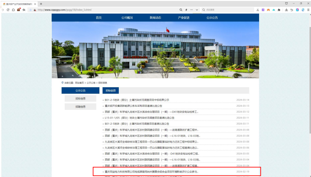
重庆铝产业开发投资集团有限公司官网“公示公告—招标信息”板块截图