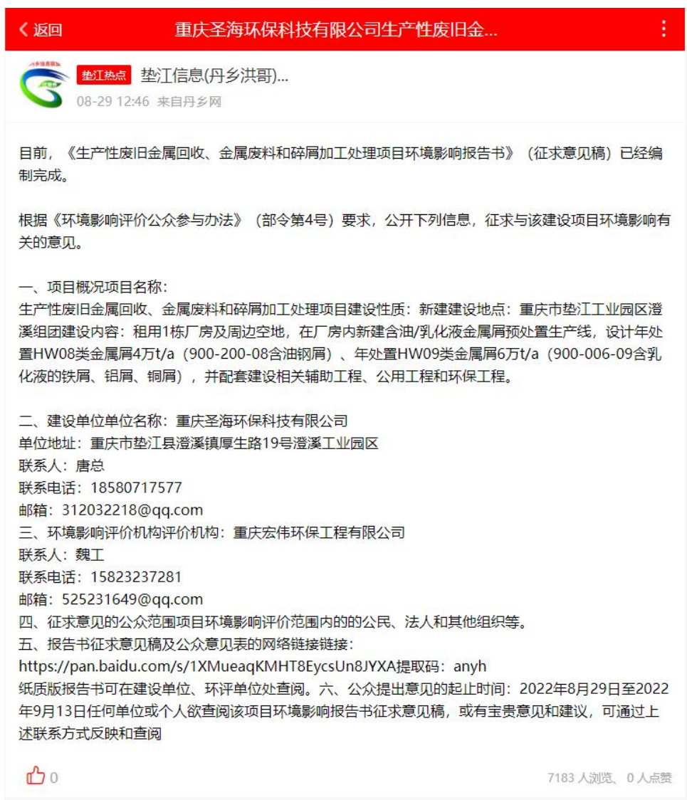
图 3-1 征求意见稿网上公示截图 2