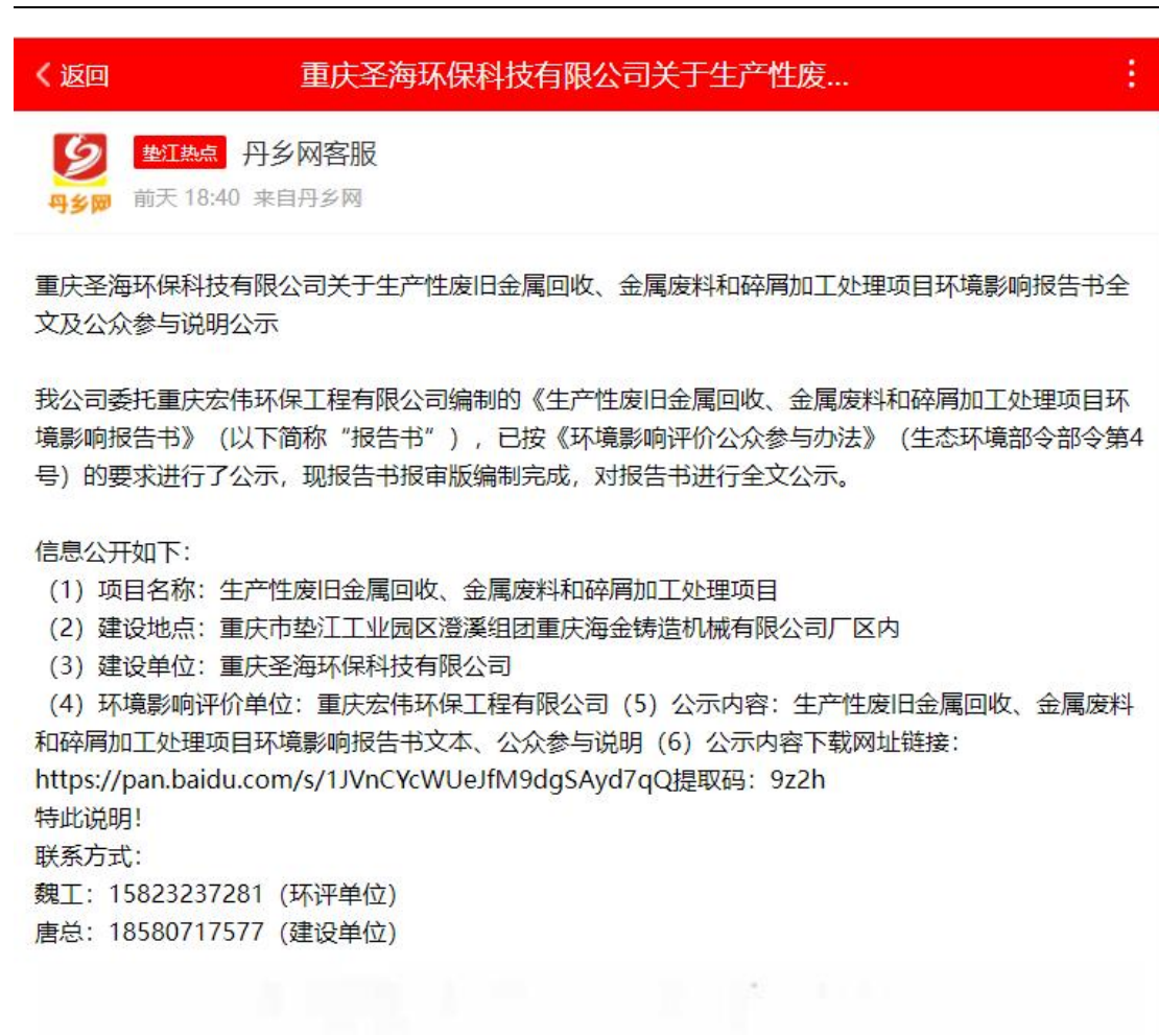
图 6-1 报批前公示稿网上公示截图