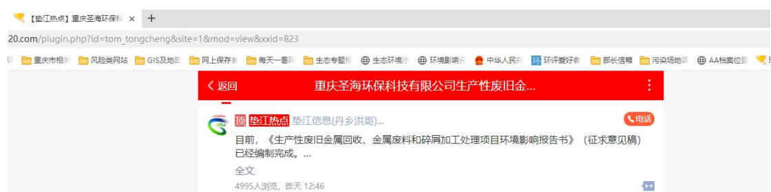
图3-1 征求意见稿网上公示截图1