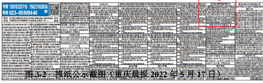
图3-2 报纸公示截图(重庆晨报 2022年5月17日)

5月9日,国务院联防联控机制召开电视电话会议指出,大城市要建立步行15分钟核酸“采样圈”。常态化核酸检测的话题越来越受到各界关注。 目前,上海静安区已经开始构建15分钟便民核酸检测点。静安区已在居民社区、商超、办公楼宇、园区企业、地铁站点、交通枢纽、工地、社区服务设施等10大类场所,共计布设完成各类核酸采样点345个。 截至5月4日,该区所有点位均具备开放条件,第一批36个点位已经开放使用。其余已具备开放条件的采样点位,后续将根据疫情防控形势发展以及复工复产需要,及时开放运营。 除上海外,杭州提出要建立1万个采样点,无锡投用了2634个,太原要建立2000个核酸检测点。 浙商银行估算,如果要实现15分钟核酸采样圈,全国需设置32万个检测点(含设备已有的),因为常态化检测后检测量会增加到8300万人份/天。 相比局部封锁,不少业内人士都认为,常态化核酸检测是优化的选择,因为后者能在传染早期快速识别、精准防控,保持更大范围内经济和社会生活的正常运转。 如果常态化核酸检测成为必然选择,构建专业队伍就成为不可回避的话题。 在北京海淀区社区卫生院工作的王丽告诉记者,目前该下沉到各个小区做核酸检测的工作人员,主要是从医院抽调的医护人员,随着疫情趋紧,核酸检测越来越频繁,抽调的人员也越来越多。 和海淀区一样,全国不少地区都是从本地公立医院系统抽调工作人员进行核酸采样。 武汉大学公共卫生学院教授于学志近期对媒体表示,常态化核酸检测工作需要大量专业人员进行操作。疫情来临之前,多数医院并没有专门负责核酸检测的人员,主要是安排各个科室人员临时负责,常态化核酸检测实施后,如果完全依靠医院分派医护人员负责,这项工作恐怕难以维系。 而随着部分地区核酸检测常态化,大量抽调本地医护人员从事核酸检测是否划算,是否会影响到正常的就诊工作,成为不少医护人员关注的焦点。 目前,多数地区的核酸检验主要由医疗检测第三方公司负责,而采样环节则由本地公立医院医护人员和第三方公司招聘的工作人员完成。近期随着检测量激增,大量招聘核酸采样人员的主要来自第三方公司。 有舆论认为,在核酸检测需求激增的情况下,在校医学生可以成为补充力量。 在张萌看来,招聘符合资质的医学生或有资质、有经验的社会人员参与到常态化核酸检测工作中,可以减轻公立医院的压力,能让医生护士更好地从事本职工作。 但不论地方政府,还是第三方公司,如何快速完成人员招募和专业的培训,确实存在难题,因为专业人员存量有限。 李敏认为,现在核酸采样人员难招的另一层原因在于工期不确定。“有几天的,有一个月的,有的声称长期却没有期限。”她说。 由于符合资质的采样人员稀缺,有招聘广告甚至打出了“干一天也行”的字样。 “常态化核酸检测队伍,亟需相对稳定的人员构成”,张萌说。 (文中张萌、王丽为化名) 据中国新闻网刊