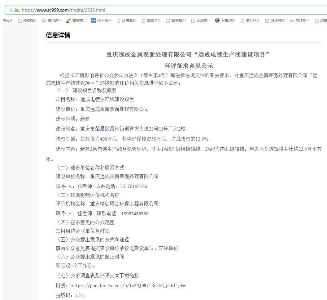
图 3-1 征求意见稿网络公示截图