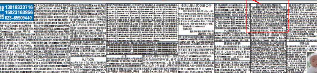
图3-3 报纸公示截图(重庆晨报 2022年5月18日)

多个城市官方喊话:多生孩子多买房! 5月17日早间,杭州发布《关于进一步促进房地产市场平稳健康发展的通知》,通知明确提到,为更好满足三孩家庭购房需求,一是符合条件的三孩家庭,在杭州限购范围内限购的住房套数增加1套;二是符合条件的三孩家庭在报名参加新建商品住房公开摇号销售时,参照“无房家庭”优先摇号。值得一提的是,通知同时优化了二手房交易政策:在本市限购范围内购买二手房,落户本市未满5年的户籍家庭无社保缴纳要求;非本市户籍家庭需在购房之日前1年起已在限购范围内连续缴纳城镇社保或个人所得税满12个月。进一步完善了税收调节:本市限购范围内,个人转让家庭唯一住房,增值税免征年限由5年调整到2年。 事实上,多个城市调控新政中,均对多孩家庭更为照顾。 5月14日,东莞发布稳楼市措施,提到“二孩或三孩家庭,允许新增购一套房”。 自5月11日起,生育二个孩子及以上南京户籍居民家庭,可新增购买一套商品住房,同时可享受相关银行最优房贷利率等支持。 5月9日,扬州发布《关于积极支持在扬来扬人才和生育二孩及以上家庭改善居住条件的通知》,在扬州的大专及以上人才和生育二孩及以上家庭在市区购房的,可适用现行限购政策。而此前扬州的限购政策规定,在市区范围内拥有第三套及以上住房的居民家庭,不得再次认购新建商品住房。 苏州提到“家庭若有新出生人口(二孩及以上),出售房屋时不受限购转让年限限制”。 无锡规定,生育二个孩子及以上的无锡户籍居民家庭,可在限购区域新增购买一套商品住房,同时对此类家庭在公积金贷款额度上进行提高。 易居研究院智库中心研究总监严跃进表示,“允许二孩及三孩新增一套房”政策充分体现了当前各地政策的重要变化,各地将“限购政策松绑+生育政策鼓励”结合导向,能够发挥积极作用,在促进市场交易活跃的同时,也有助于推进人口生育政策。 据新华社·每日经济新闻